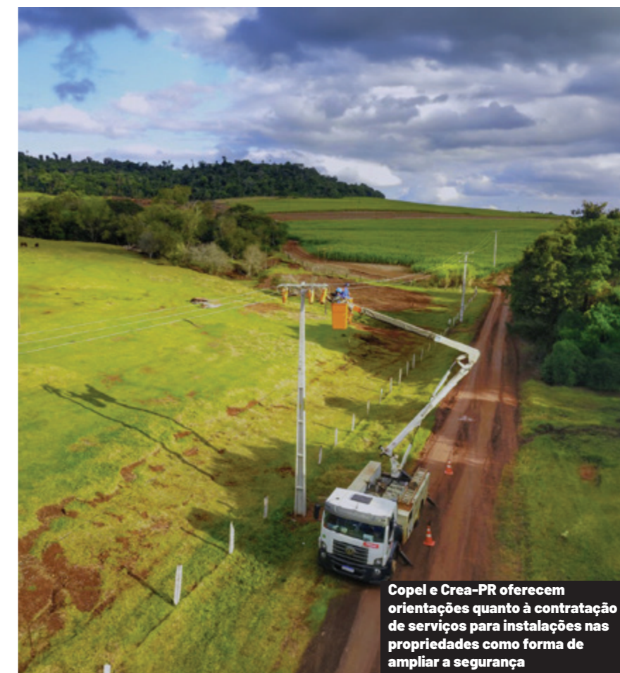
Copel e Crea-PR oferecem orientações quanto à contratação de serviços para instalações nas propriedades como forma de ampliar a segurança