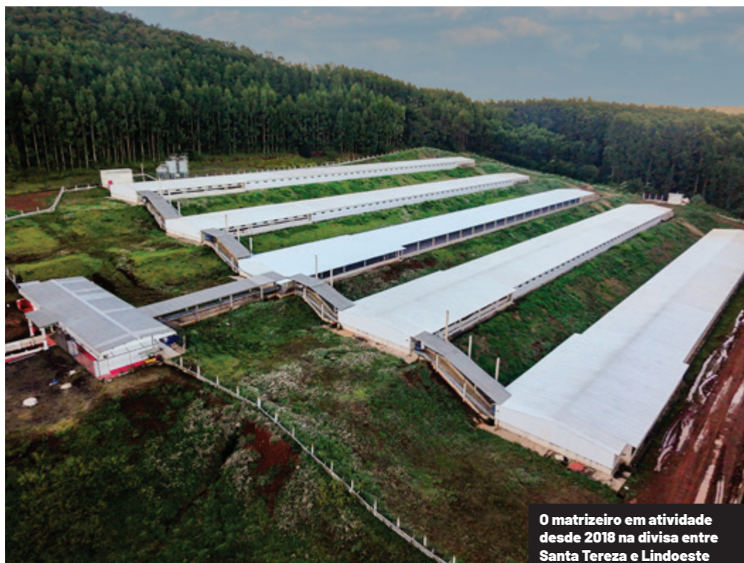
O matrizeiro em atividade desde 2018 na divisa entre Santa Tereza e Lindoeste