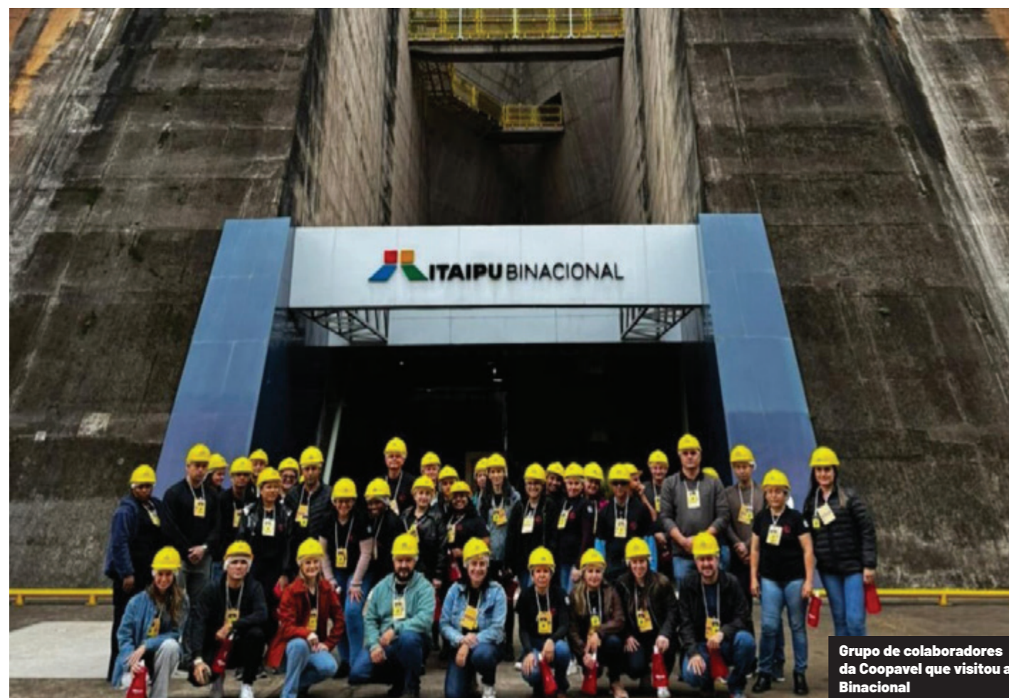
Grupo de colaboradores da Coopavel que visitou a Binacional

A produção anual varia segundo a afluência do rio, mas fica na média de 70 milhões de megawatts. A melhor marca foi alcançada em 2016, quando ela produziu 103 milhões de megawatts. A hidrelétrica atende a cerca de 7% a 8% de toda a demanda de eletricidade do Brasil e por volta de 85% do consumo do Paraguai.