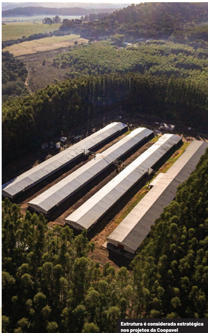
Estrutura é considerada estratégica nos projetos da Coopavel

deverá subir em cerca de 3,5 milhões por mês até que, em no máximo dois anos, o complexo atinja a marca de dez milhões de ovos férteis mensais. O quadro de funcionários, acrescido de 60 novos colaboradores, chegará então a 300 pessoas.