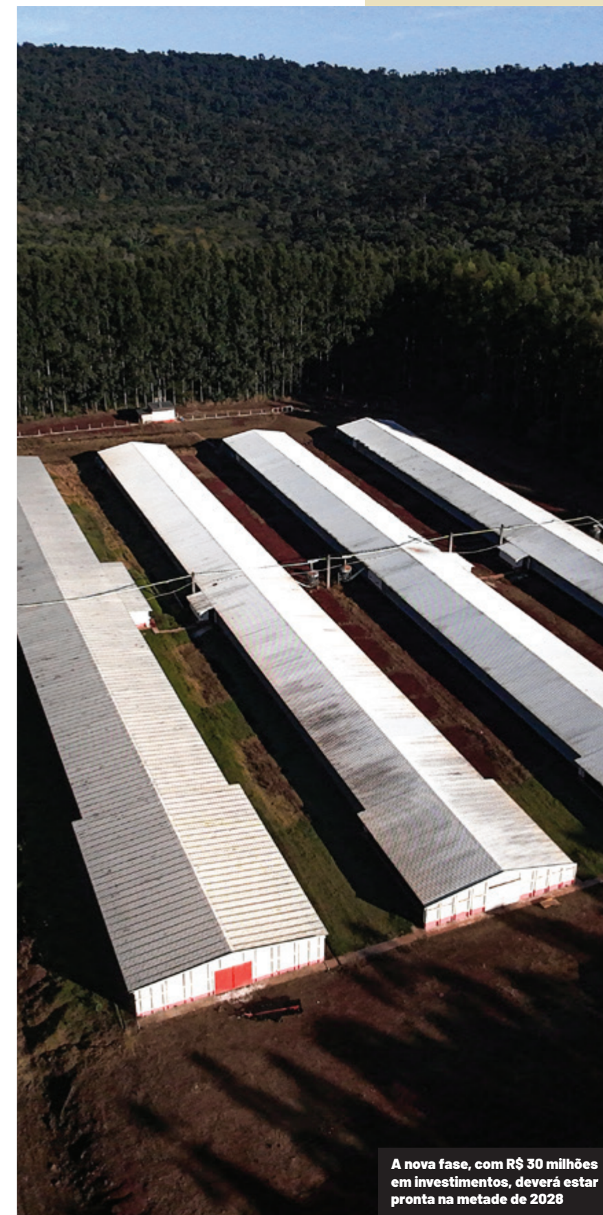
A nova fase, com R$ 30 milhões em investimentos, deverá estar pronta na metade de 2028

Com a conclusão da segunda etapa, a produção de ovos férteis