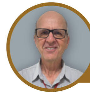
Filial de Campo Bonito

OAB/PR 24.483 Advogado na VANZO ADVOGADOS Compliance Officer ACIC