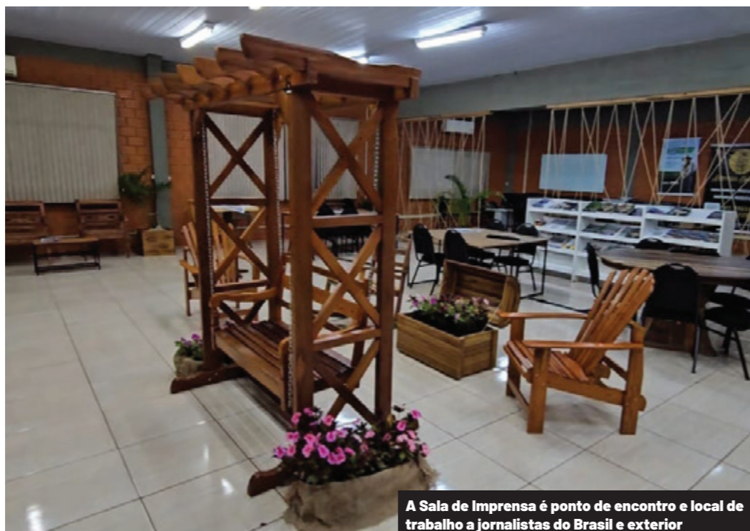
A Sala de Imprensa é ponto de encontro e local de trabalho a jornalistas do Brasil e exterior