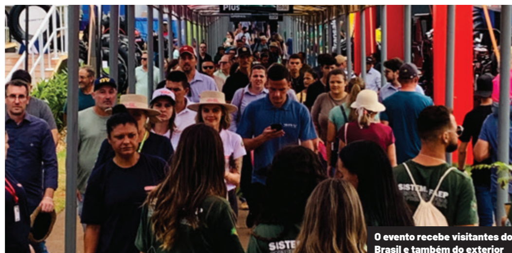
O evento recebe visitantes do Brasil e também do exterior

1989 foi o ano de realização da primeira edição, com 110 visitantes e 15 expositores