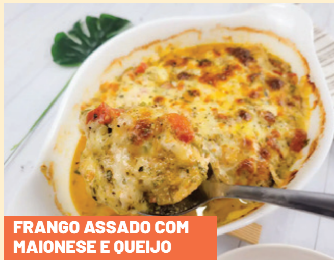
FRANGO ASSADO COM MAIONESE E QUEIJO