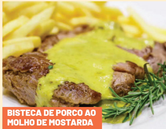
BISTECA DE PORCO AO MOLHO DE MOSTARDA

Tempere os filés de frango com sal, pimenta-do-reino, mix de temperos e o alho amassado. Misture bem e deixe marinando por 30 minutos; Depois, transfira os filés para um refratário untado com azeite e que possa ir ao forno. Reserve; Para o molho, coloque em um recipiente, o tomate, a cebola, o cheiro-verde, a maionese e tempere com sal, pimenta-do-reino e páprica defumada. Misture tudo muito bem; Em seguida, acrescente o molho por cima dos filés de frango no refratário Distribua a mussarela ralada por cima e salpique um pouco de orégano; Leve ao forno preaquecido a 180°C e asse por cerca de 30 minutos ou até dourar levemente. Retire e sirva.