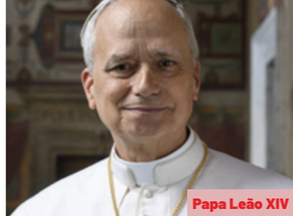
Papa Leão XIV

A Igreja, presente no mundo como sinal de unidade para toda a família humana, reconhece nas questões e nos desafios do tempo atual o lugar onde deve exercer a própria vocação à escuta, ao diálogo e ao serviço, deixando-se interpelar por tudo o que diz respeito à existência dos homens e das mulheres de hoje. Essa interligação vital com os povos faz-lhe compreender cada vez mais que a sua missão tem um alcance histórico e implica responsabilidade no que diz respeito à maneira como se tecem as relações sociais.