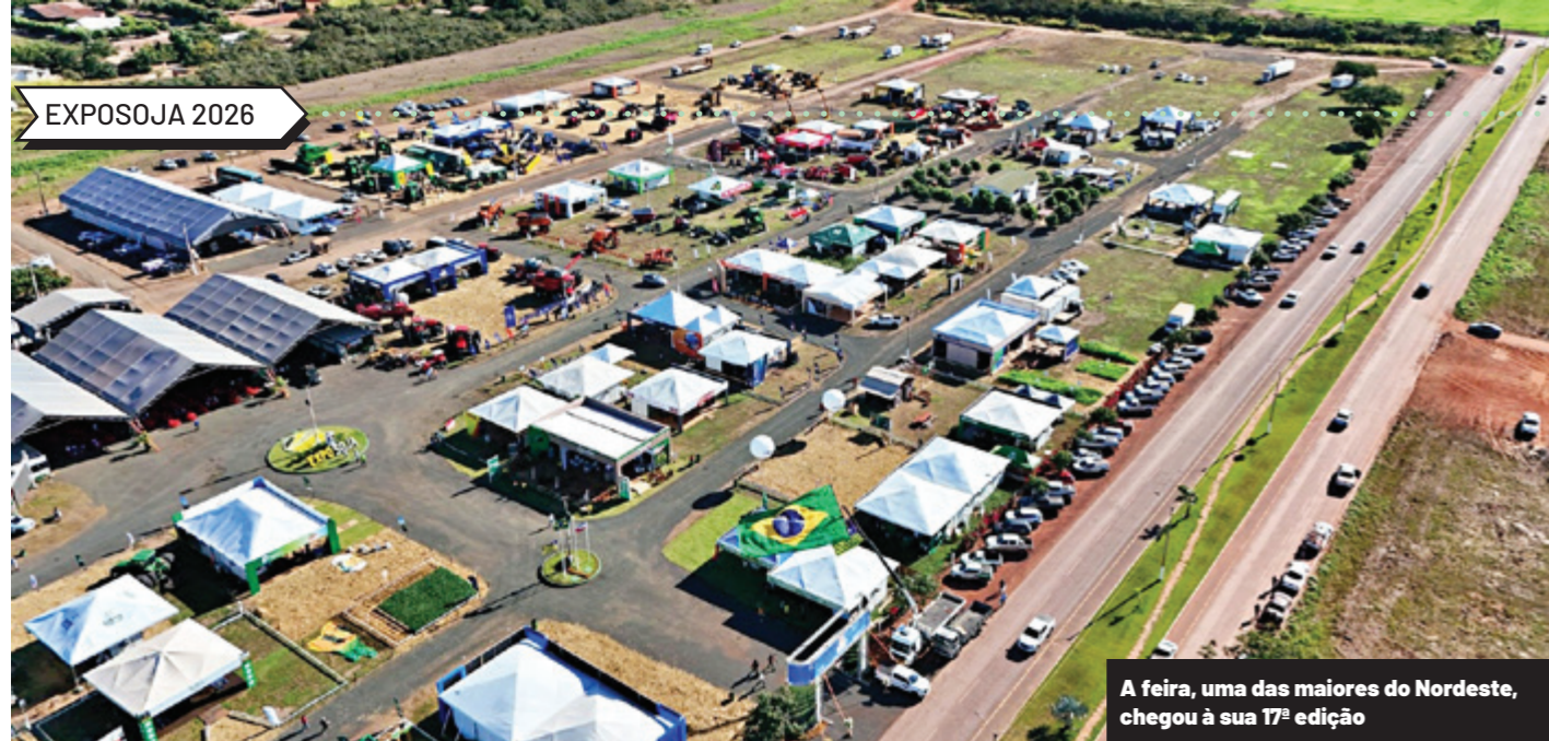
A feira, uma das maiores do Nordeste, chegou à sua 17ª edição