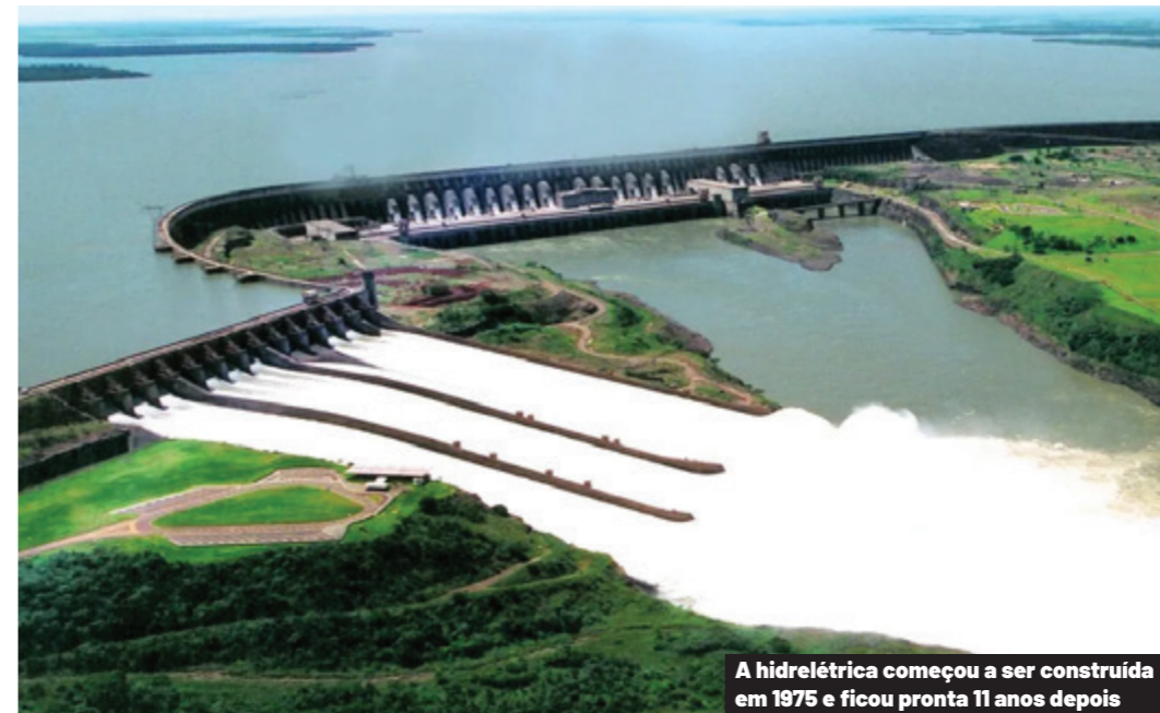
A hidrelétrica começou a ser construída em 1975 e ficou pronta 11 anos depois

Trinta e sete colaboradores da Coopavel, que atuam no frigorífico de suínos, acabam de participar de uma viagem técnica à Usina de Itaipu, em Foz do Iguaçu. Eles tiveram a oportunidade de conhecer a maior hidrelétrica de energia limpa do mundo, considerada um dos destaques da engenharia contemporânea e que coloca Brasil e Paraguai entre os principais detentores de fontes renováveis do planeta de um insumo imprescindível à modernidade.