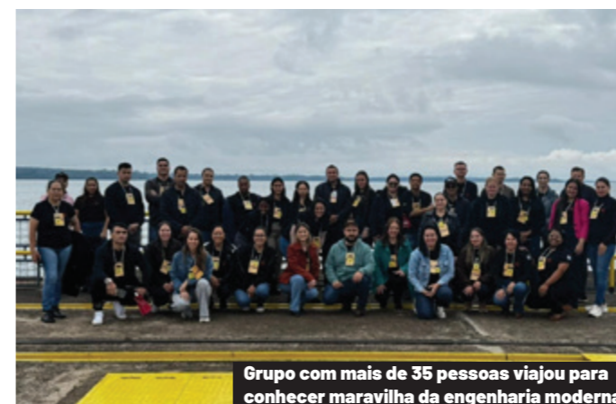
Grupo com mais de 35 pessoas viajou para conhecer maravilha da engenharia moderna