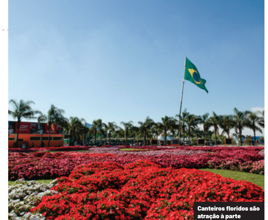
Canteiros floridos são atração à parte

A primeira edição, em 1989, recebeu 110 visitantes e apenas 15 expositores. O crescimento foi consecutivo e vertiginoso desde então. Nas 38 edições já desenvolvidas, o número de expositores, somados, totaliza 12 mil, do Brasil e exterior. E a soma dos visitantes ultrapassa 5,6 milhões de pessoas, o equivalente a quase 15 vezes a população do município-anfitrião (Cascavel) ou mais de três vezes o número de habitantes de Curitiba.