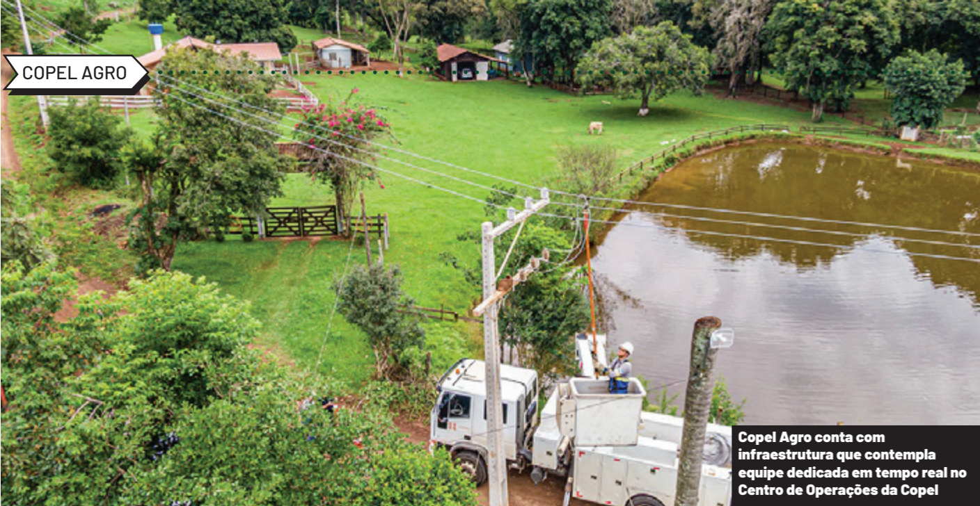
Copel Agro conta com infraestrutura que contempla equipe dedicada em tempo real no Centro de Operações da Copel