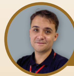
Filial de Céu Azul

Os desequilíbrios e deficiências de macro nutrientes não conseguem ser corrigidos em culturas anuais usando pulverizações por serem requeridos em grandes quantidades, porém os micronutrientes por serem requeridos em menor volume poderão ser aplicados via foliar. Deficiências nem sempre são supridas totalmente via foliar, por isso no controle de doenças de plantas, devem ser tomadas com procedimentos de manejo do solo e da cultura de forma que possíveis deficiências nutricionais sejam detectadas antecipadamente.