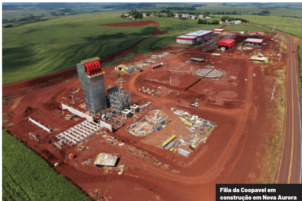
Filia da Coopavel em construção em Nova Aurora

O BNDES aprovou apoio de R$ 79,9 milhões, com recursos do programa Finem, para a Coopavel Cooperativa Agroindustrial implantar duas novas unidades de recebimento, beneficiamento e armazenagem de grãos no Oeste do Paraná. O investimento total previsto é de R$ 84,5 milhões, com recursos destinados a projetos em Nova Aurora e Cascavel.