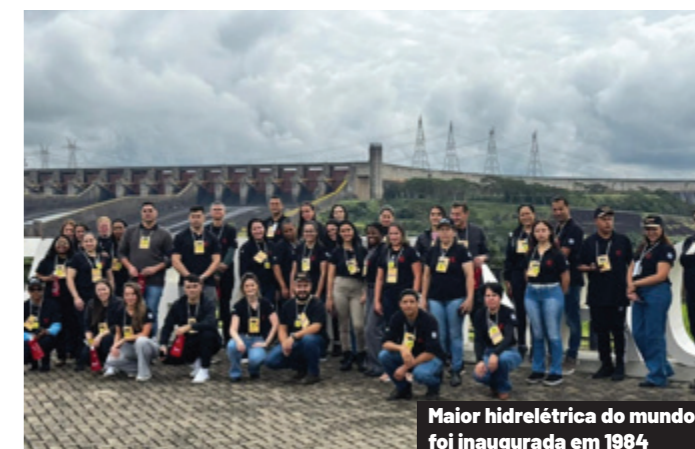
Maior hidrelétrica do mundo foi inaugurada em 1984