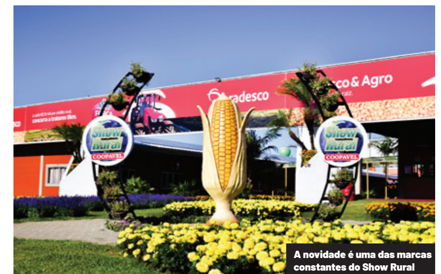
A novidade é uma das marcas constantes do Show Rural