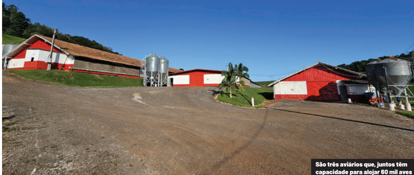
São três aviários que, juntos têm capacidade para alojar 60 mil aves