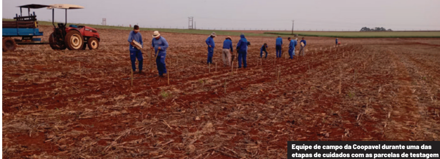
Equipe de campo da Coopavel durante uma das etapas de cuidados com as parcelas de testagem