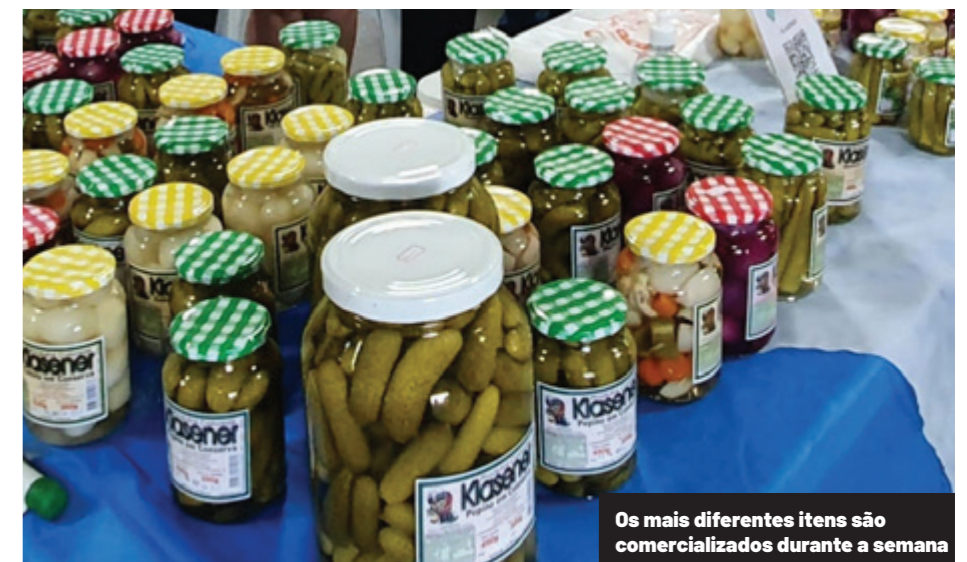
Os mais diferentes itens são comercializados durante a semana

A feira acentua sua importância também pela diversidade de produtos oferecidos, com pequenos produtores cada vez mais especializados em itens de alto valor agregado, inovação, qualidade e segurança alimentar. Os dados apontam que 20% dos expositores comercializaram panificados, massas e biscoitos; 13% bebidas como sucos, vinhos, espumantes, cachaças e licores; 13% derivados de leite, com destaque para