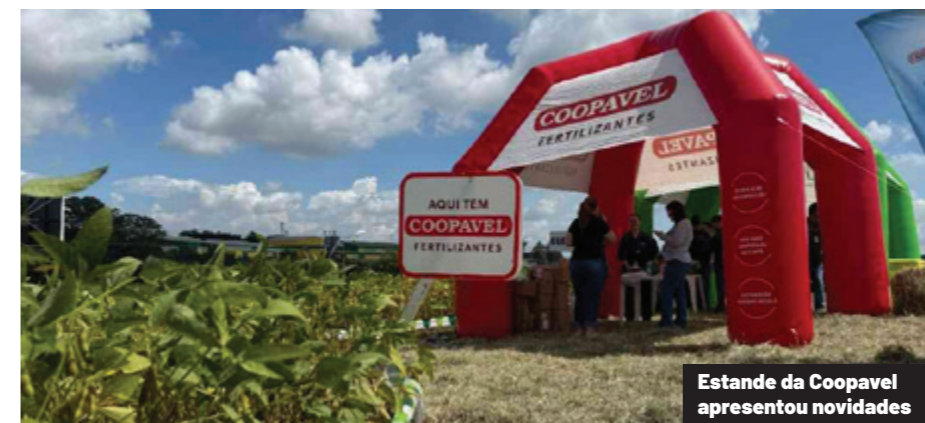
Estande da Coopavel apresentou novidades