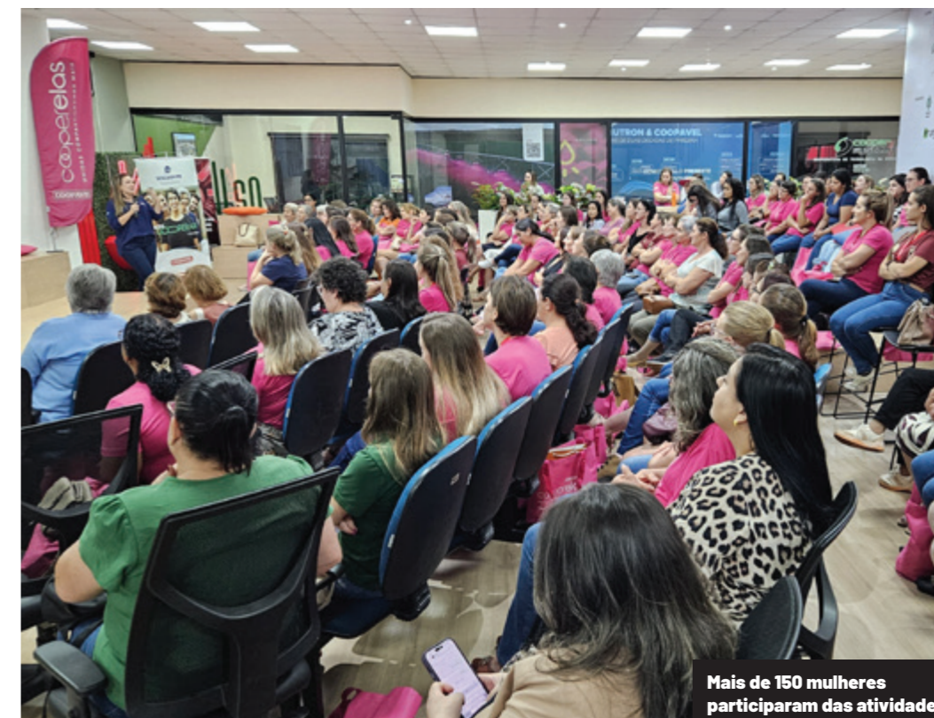
Mais de 150 mulheres participaram das atividades

A mulher, com suas habilidades e sensibilidade, contabiliza vitórias nos mais diferentes setores e em alguns deles, a exemplo do agronegócio, as habilidades femininas as tornam protagonistas de avanços e processos enriquecedores. Esse e outros assuntos foram debatidos durante o Impulso Day Cooperelas, organizado pela Unicoop (Universidade Coopavel) em parceria com Espaço Impulso e Itaipu Parquetec, em comemoração ao 8 de março, Dia Internacional da Mulher.