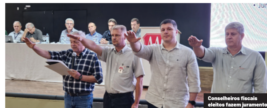
Conselheiros fiscais eleitos fazem juramento