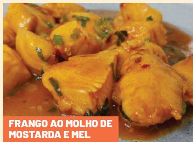
FRANGO AO MOLHO DE MOSTARDA E MEL