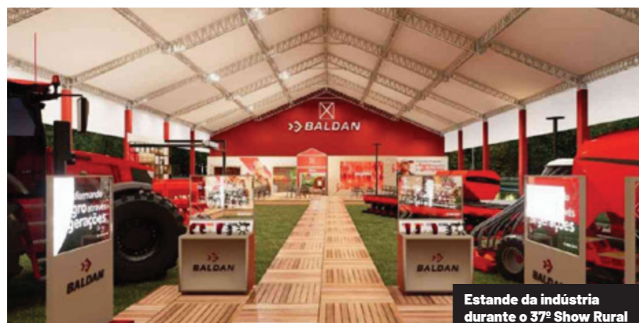
Estande da indústria durante o 37º Show Rural

“Essa colaboração reflete o compromisso de ambas as instituições com o futuro do agrone-