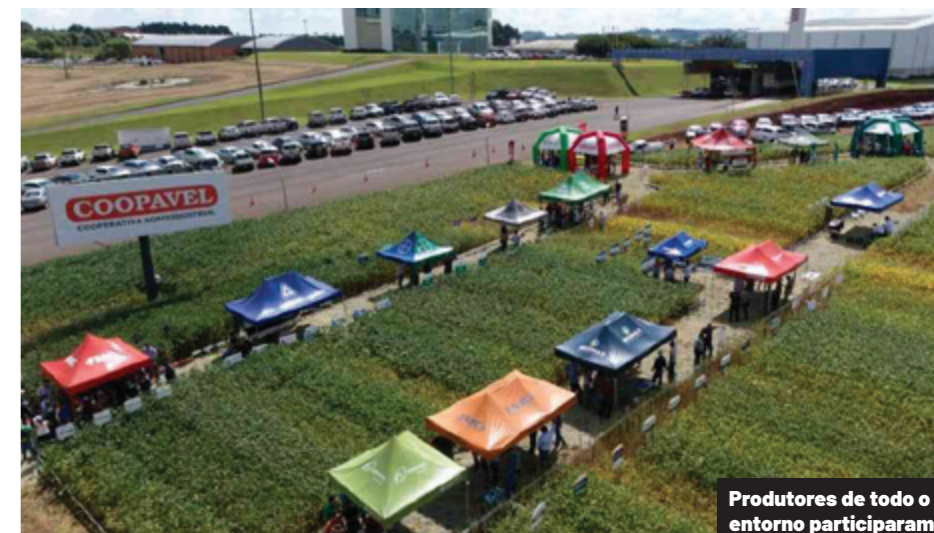
Produtores de todo o entorno participaram

A cooperativa apresentou produtos como Fertilizantes Coopavel, Sementes Coopavel, Nutriagro, Biocoop (indústria de insumos biológicos), Rações Coopavel, Coopclean (indústria de materiais de higiene e limpeza), Credicoopavel, moinhos de trigo e frigoríficos Coopavel.