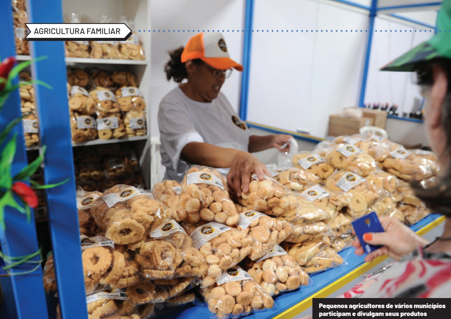
Pequenos agricultores de vários municípios participam e divulgam seus produtos