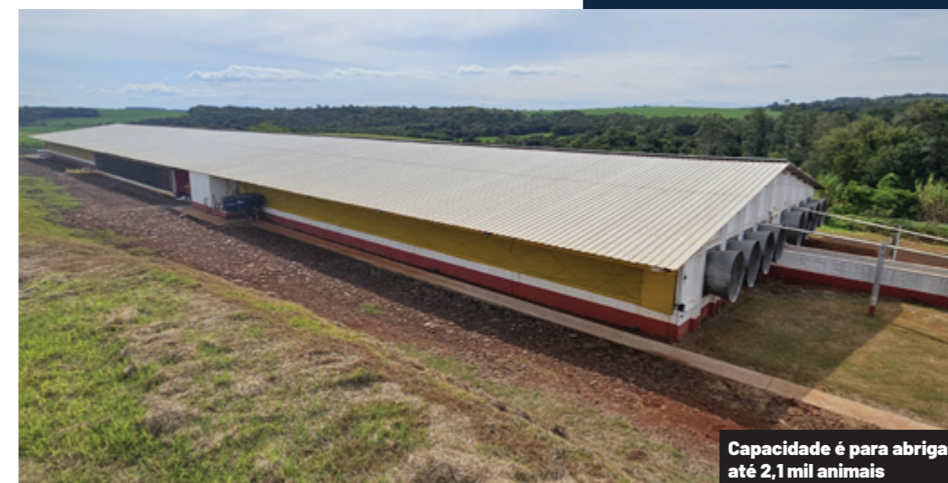
Capacidade é para abrigar até 2,1 mil animais