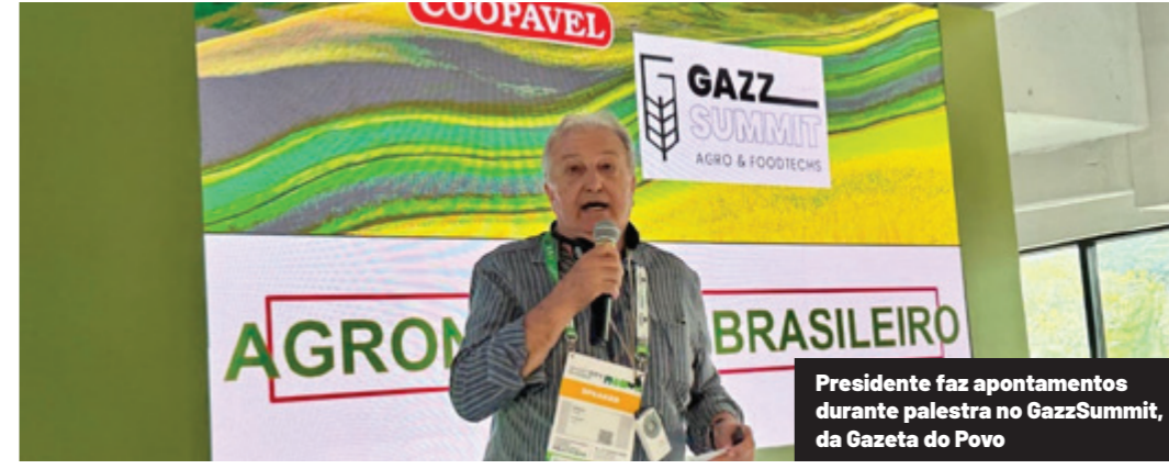
Presidente faz apontamentos durante palestra no GazzSummit, da Gazeta do Povo