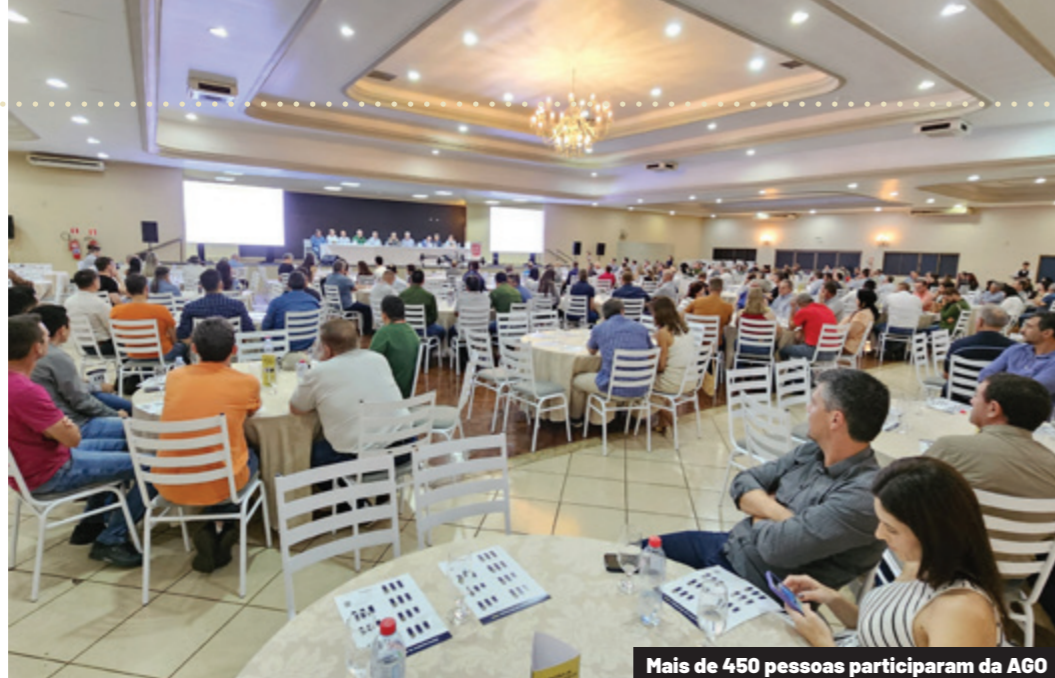
Mais de 450 pessoas participaram da AGO