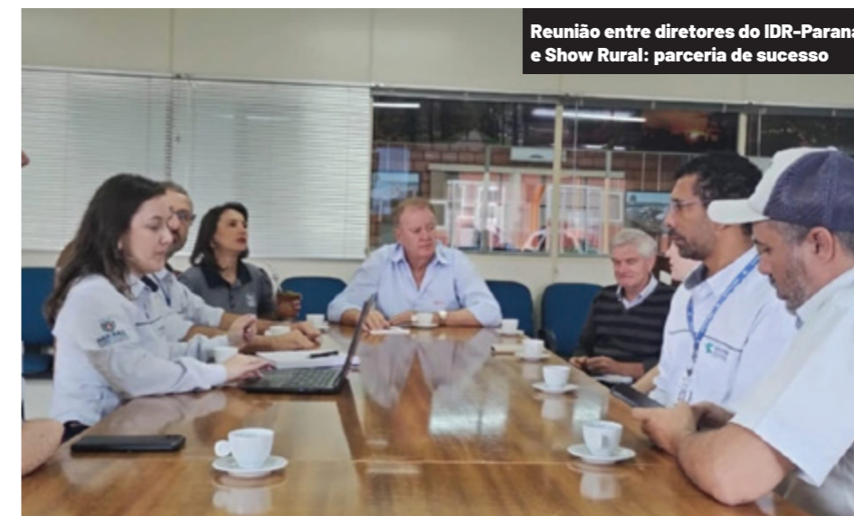
Reunião entre diretores do IDR-Paraná e Show Rural: parceria de sucesso