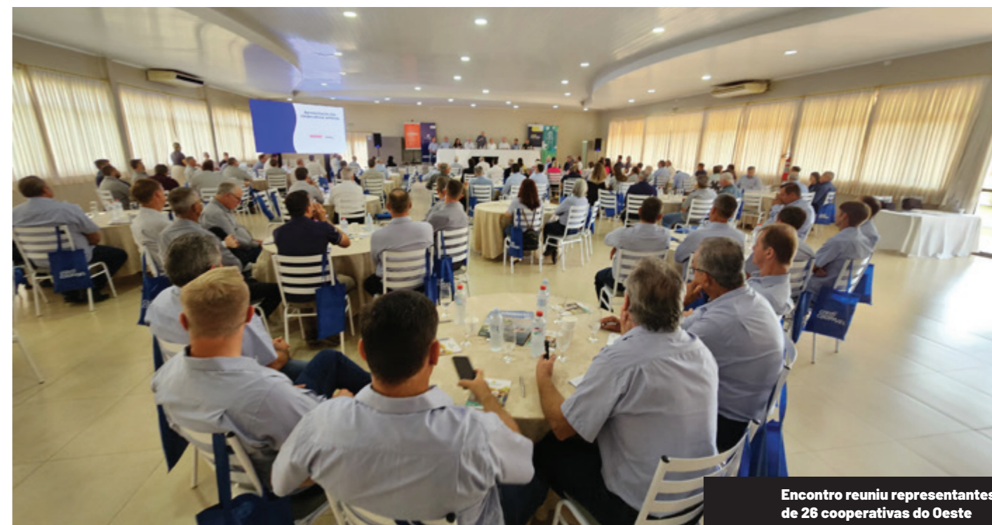
Encontro reuniu representantes de 26 cooperativas do Oeste