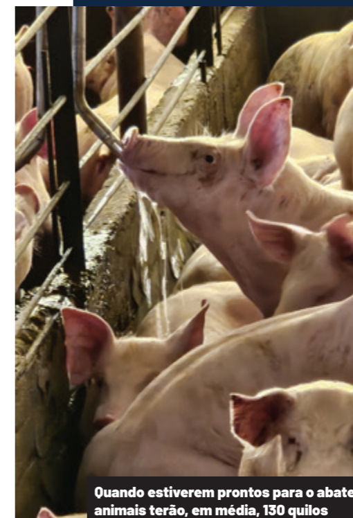
Quando estiverem prontos para o abate, animais terão, em média, 130 quilos