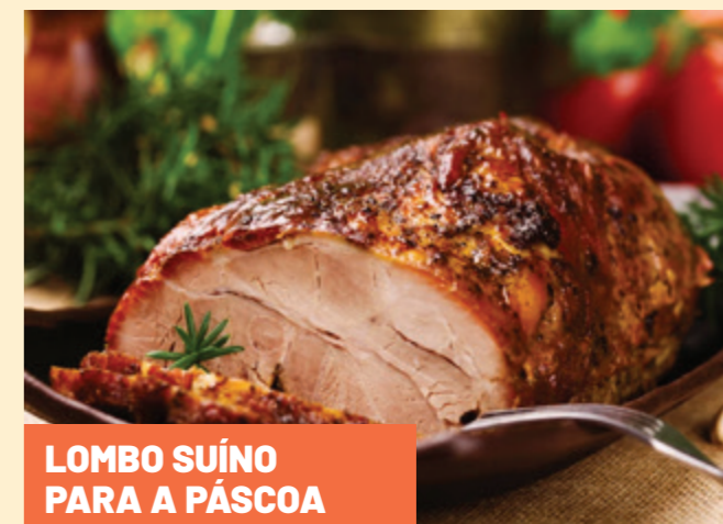
LOMBO SUÍNO PARA A PÁSCOA