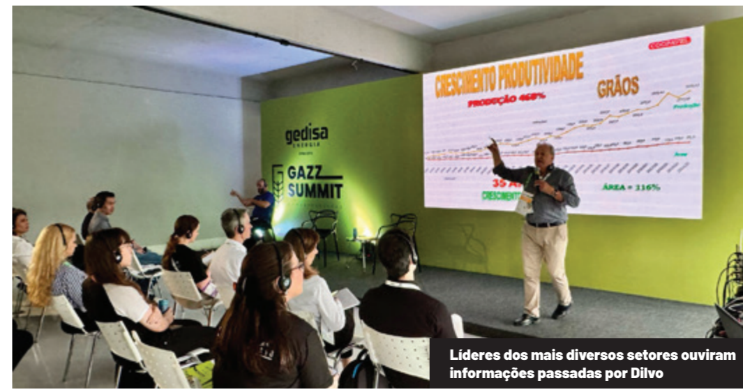
Líderes dos mais diversos setores ouviram informações passadas por Dilvo

O GazzSummit Agro e FoodTechs, promovido pela Gazeta do Povo, busca ser um dos principais fóruns de discussão sobre inovação no agronegócio e no setor de alimentos e bebidas.