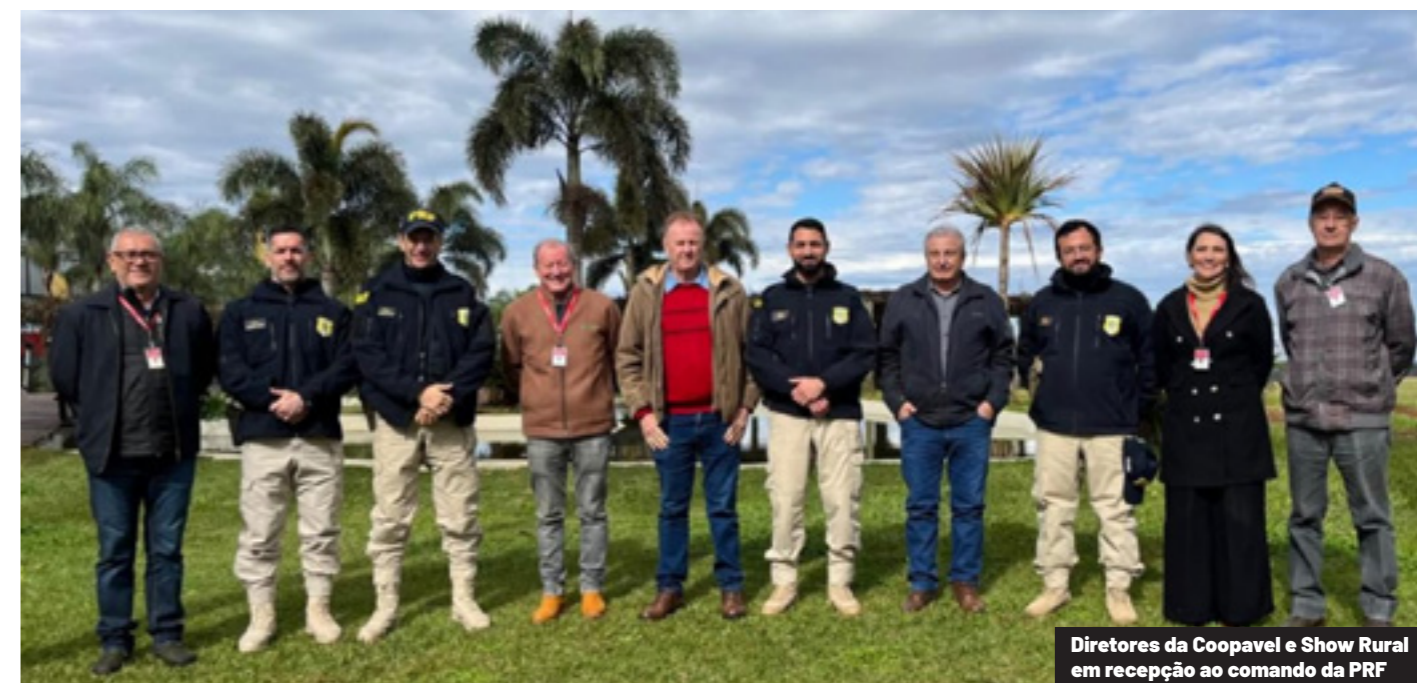
Diretores da Coopavel e Show Rural em recepção ao comando da PRF