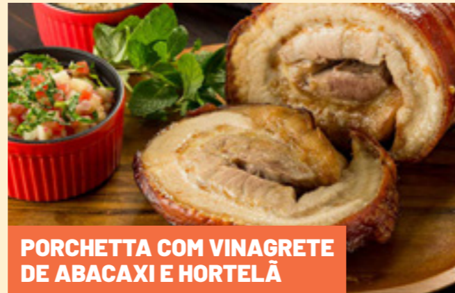
PORCHETTA COM VINAGRETE DE ABACAXI E HORTELÃ