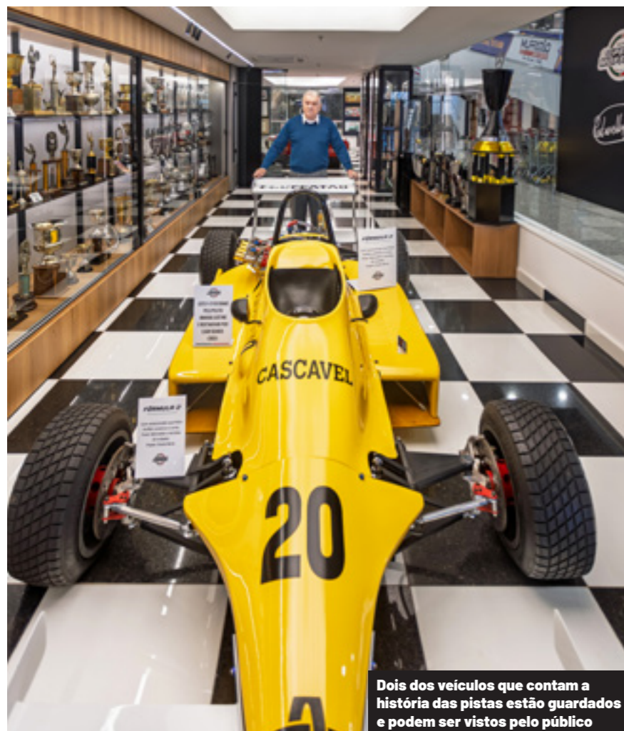
Dois dos veículos que contam a história das pistas estão guardados e podem ser vistos pelo público