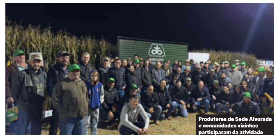
Produtores de Sede Alvorada e comunidades vizinhas participaram da atividade