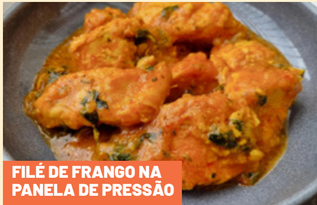
FILÉ DE FRANGO NA PANELA DE PRESSÃO