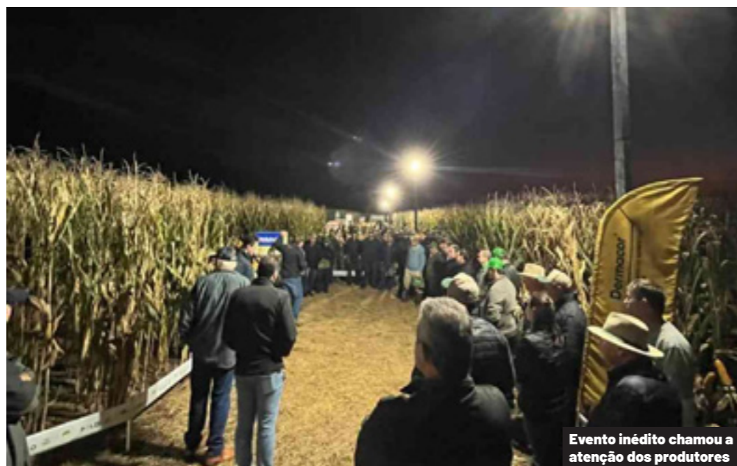
Evento inédito chamou a atenção dos produtores

Agricultores cooperados da Coopavel participaram, dias atrás, de edição inédita de Noite de Campo realizada na Área Polo da Pioneer, em Sede Alvorada, distrito de Cascavel. O evento foi marcado por criatividade, alto nível técnico e uma estrutura diferenciada, com ambiente totalmente iluminado e organizado em estações exclusivas para facilitar o acesso dos participantes às informações e novidades apresentadas pela Pioneer.