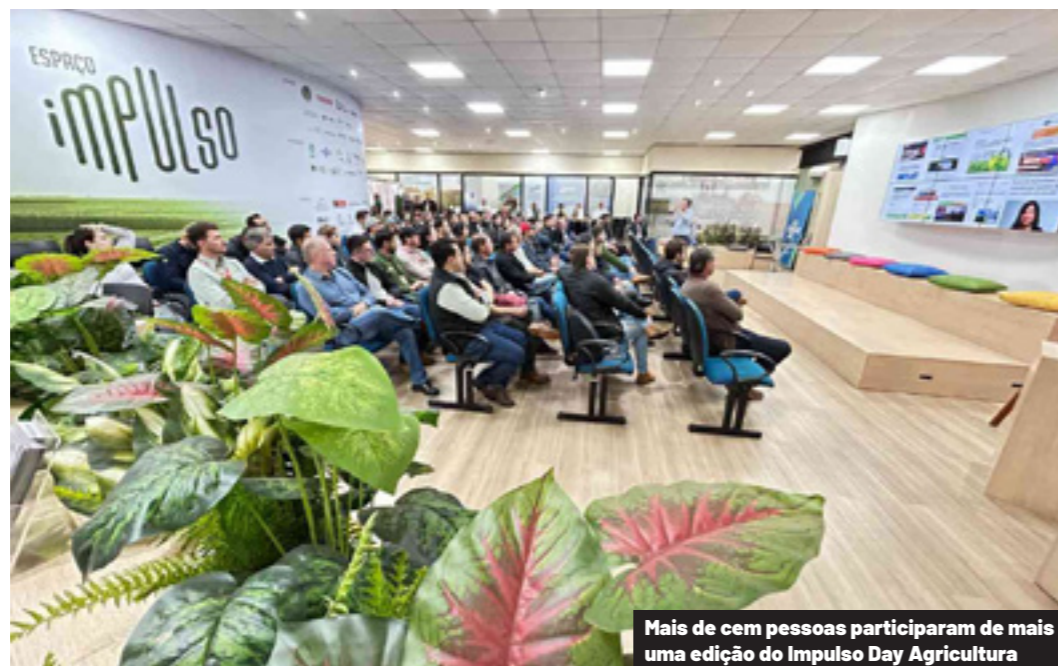
Mais de cem pessoas participaram de mais uma edição do Impulso Day Agricultura

Dentro do calendário de eventos do Espaço Impulso, a Coopavel e o Itaipu Parquetec promoveram, recentemente, mais uma edição do Impulso Day Agricultura. O encontro reuniu mais de cem participantes entre cooperados, técnicos, parceiros e acadêmicos para um dia de palestras e trocas sobre inovação, tecnologia e estratégias voltadas à produção agrícola.