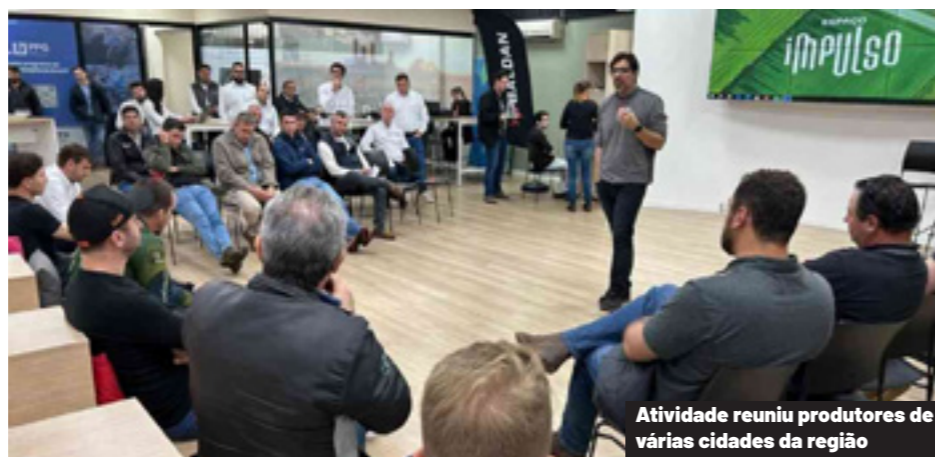
Atividade reuniu produtores de várias cidades da região

Por mais de três horas, os produtores tiveram contato direto com o time da Baldan, composto por profissionais das