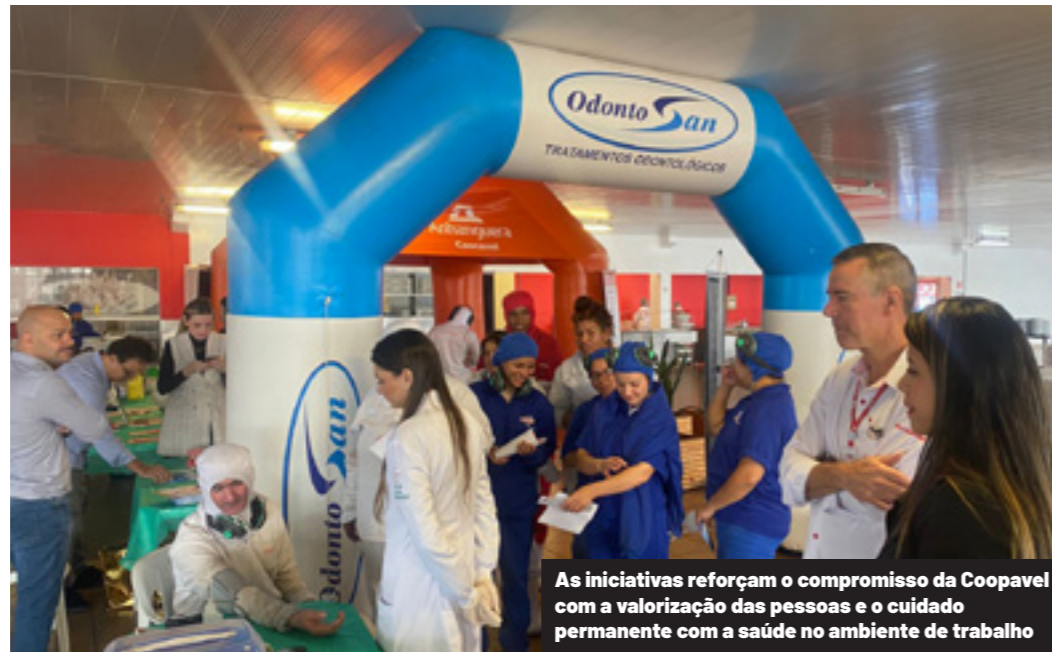
As iniciativas reforçam o compromisso da Coopavel com a valorização das pessoas e o cuidado permanente com a saúde no ambiente de trabalho

Com o compromisso de promover a saúde e a qualidade de vida no ambiente corporativo, o setor de Enfermagem do Trabalho da Coopavel tem se destacado pela condução de projetos preventivos e de conscientização voltados aos colaboradores da área industrial da cooperativa. Uma das ações mais expressivas realizadas recentemente foi o Dia da Saúde, dentro da programação da Sipat (Semana Interna de Prevenção de Acidentes no Trabalho), que superou todas as expectativas da organização.