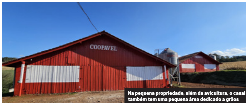
Na pequena propriedade, além da avicultura, o casal também tem uma pequena área dedicado a grãos

cipal fonte de renda da família, foi abraçada pelo casal como alternativa de sobrevivência e, aos poucos, tornou-se pilar de prosperidade. O dinheiro economizado em anos de labuta com o tabaco garantiu a entrada no primeiro aviário, com os recursos do confinamento de aves construíram o segundo barracão e hoje levantam, na cidade, a casa onde planejam viver na velhice. Também foi com os recursos gerados na propriedade que ajudaram a formar as três filhas. Duas já são