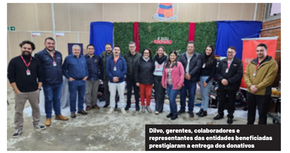
Dilvo, gerentes, colaboradores e representantes das entidades beneficiadas prestigiaram a entrega dos donativos