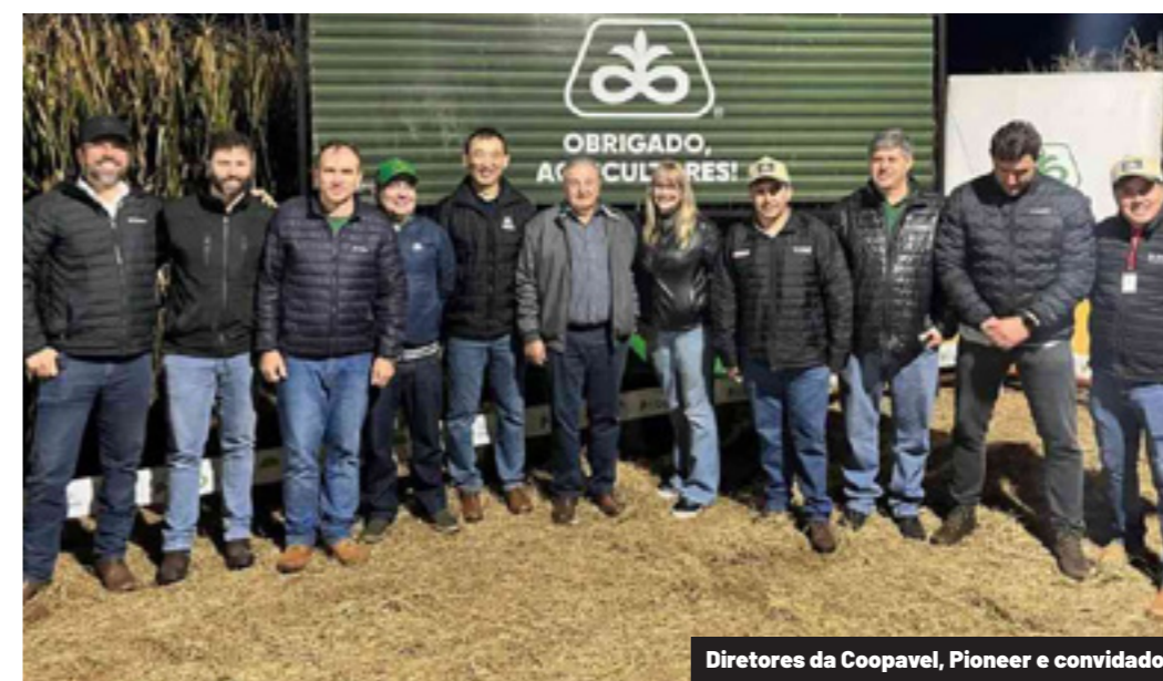
Diretores da Coopavel, Pioneer e convidados

O encerramento ficou por conta da apresentação do mais recente lançamento no tratamento de sementes industriais: o Lumitreo, fungicida que passa a compor o portfólio voltado à proteção inicial das sementes. O evento também contou com a apresentação do painel de híbridos da Pioneer, mostrando ao público o que há de mais atual no mercado e os materiais que estão chegando com tecnologias avançadas.