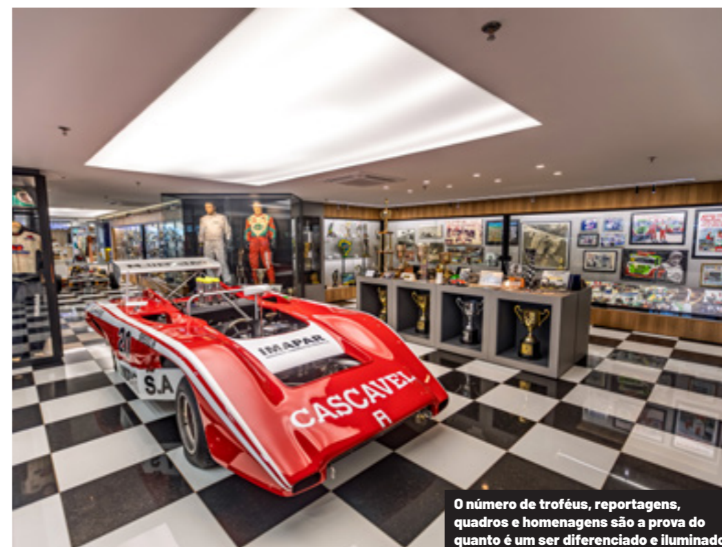
O número de troféus, reportagens, quadros e homenagens são a prova do quanto é um ser diferenciado e iluminado