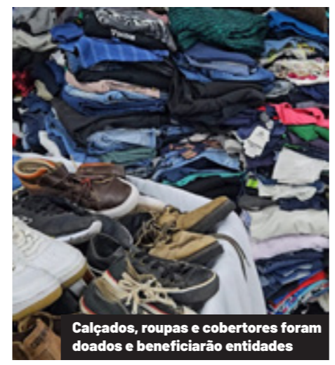
Calçados, roupas e cobertores foram doados e beneficiarão entidades

As cinco unidades que mais arrecadaram expressam o forte envolvimento e o espírito solidário de todas as unidades da Coopavel. A Indústria Frigorífica de Aves foi a que obteve o maior volume de arrecadações, com 844 peças, seguida pela