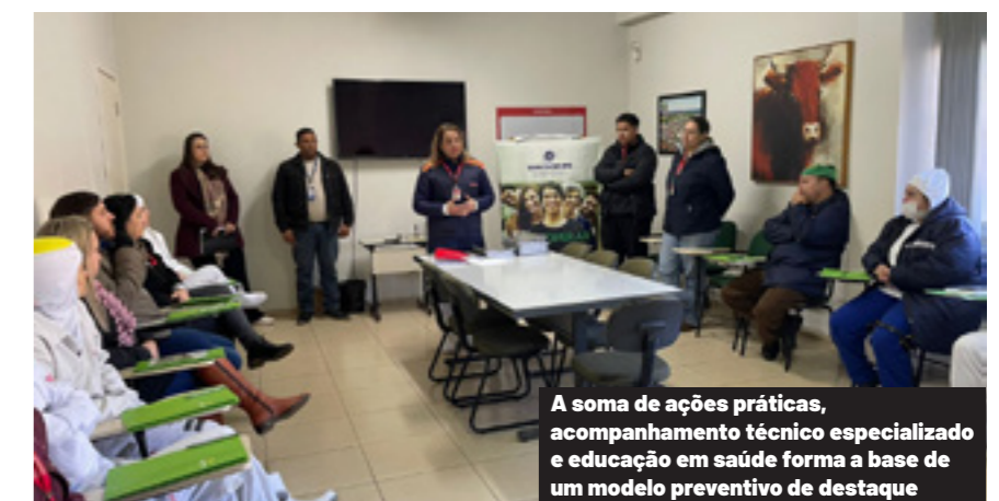
A soma de ações práticas, acompanhamento técnico especializado e educação em saúde forma a base de um modelo preventivo de destaque