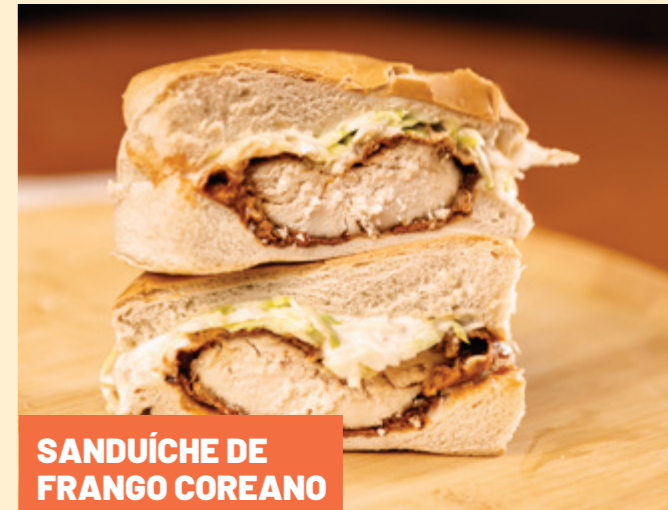
SANDUÍCHE DE FRANGO COREANO