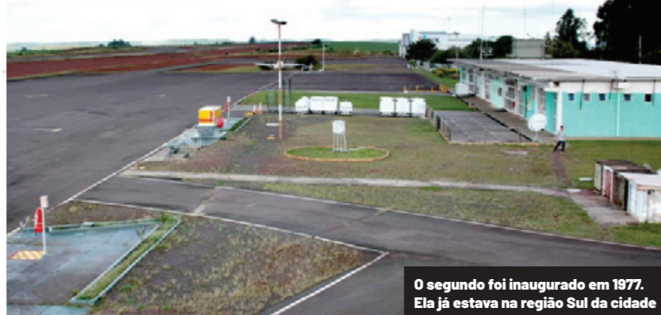
O segundo foi inaugurado em 1977. Ela já estava na região Sul da cidade

O ex-prefeito Leonaldo Paranhos, responsável por destravar obras do terminal de passageiros, diz que o aeroporto foi uma decisão tomada junto com o setor produtivo da cidade, junto com as entidades. Esse era um tema já muito desgastado na cidade. Desde o Governo Jaime Lerner, quando foi anunciado um aeroporto regional para o Oeste, e não aconteceu. “O nosso aeroporto era de pista, de estacionamento, de infraestrutura de estação de embarque e nós precisávamos tomar