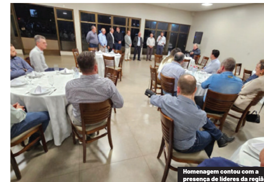
Homenagem contou com a presença de líderes da região