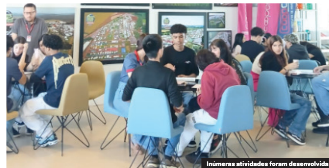
Inúmeras atividades foram desenvolvidas

O Impulso Jovem segue, assim, cumprindo seu papel de formar profissionais engajados e preparados, enquanto reforça a identidade da cooperativa. A presença dos tutores nesta edição foi um marco de integração, aprendizado e inspiração – e já deixou vontade de ser repetida.