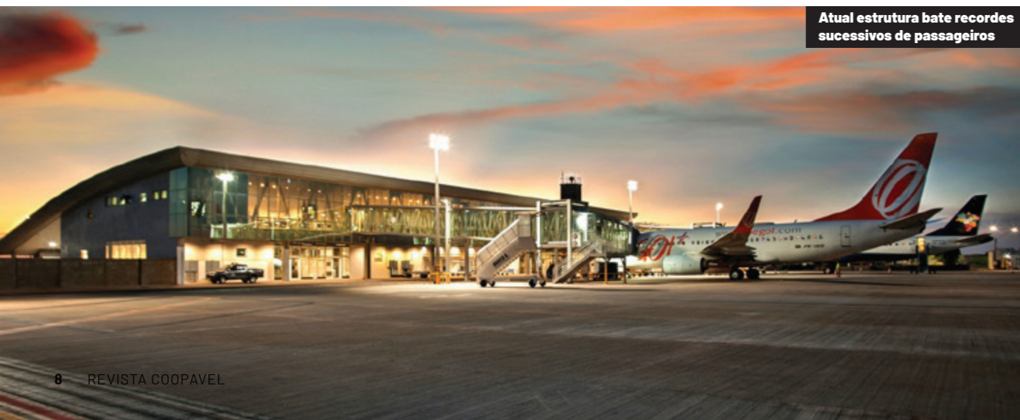
Atual estrutura bate recordes sucessivos de passageiros

37 MIL FOI A MÉDIA DE PASSAGEIROS POR MÊS