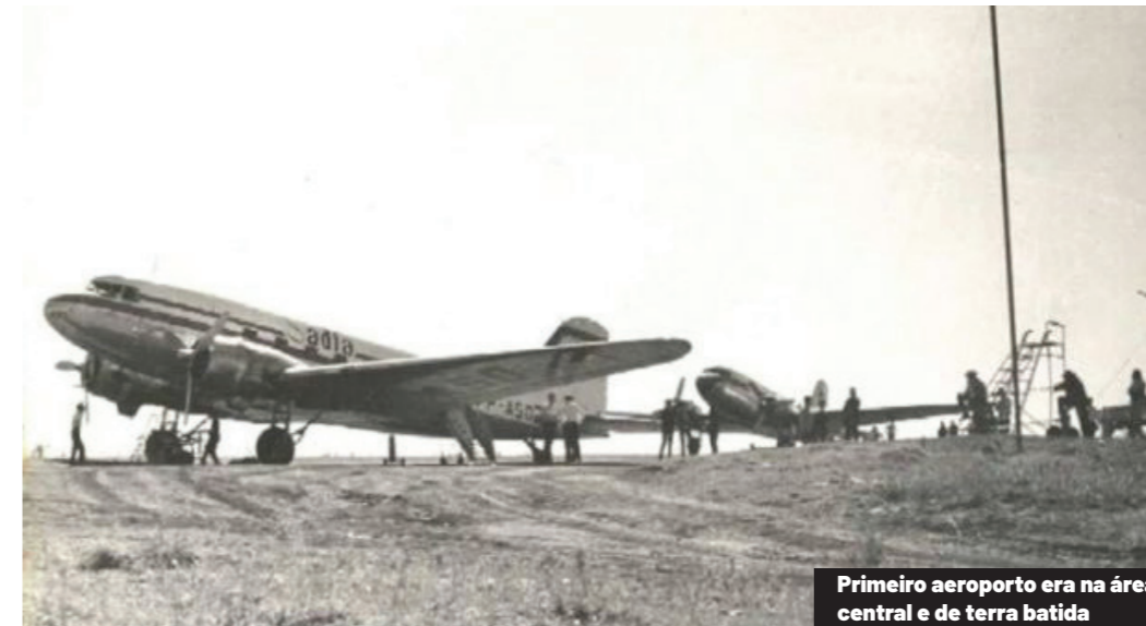
Primeiro aeroporto era na área central e de terra batida

Há 72 anos, Cascavel assistia ao primeiro voo regular de sua história. Em 2 de janeiro de 1953 era inaugurado o então Aeroporto Regional, que nove dias depois receberia um Douglas DC-3 com apenas 15 passageiros. A pista de grama e terra, em área vizinha à atual prefeitura, representava mais do que infraestrutura: era o início de um sonho que, com garra e determinação de líderes e da comunidade, se transformaria em um dos aeroportos mais modernos e premiados do Brasil.