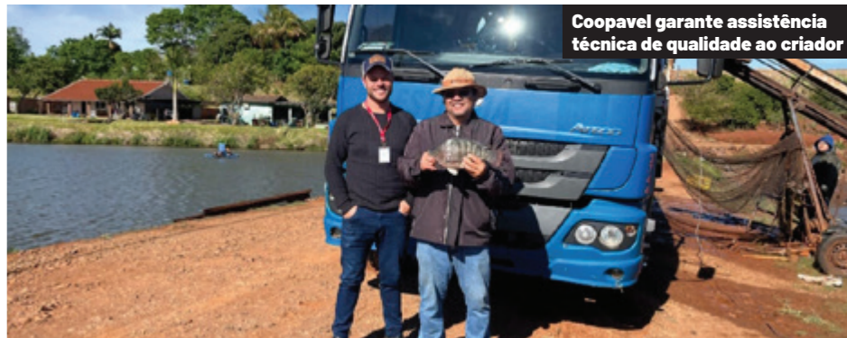
Coopavel garante assistência técnica de qualidade ao criador