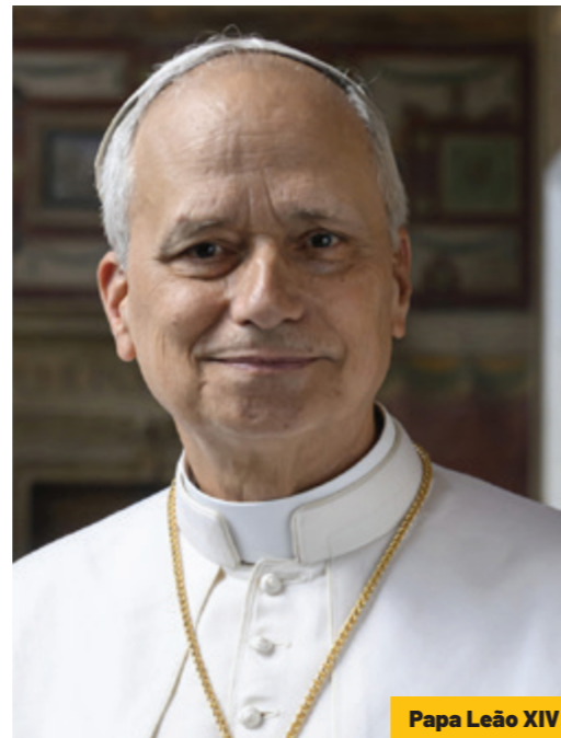
Papa Leão XIV

“Eis escolhas radicais e cheias de significado: o matrimônio, a ordem sagrada, a consagração religiosa expressam a doação de si mesmo, livre e libertado-