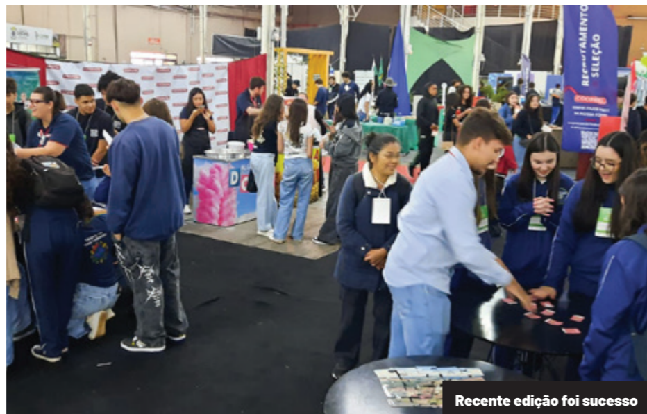
Recente edição foi sucesso

Pelo quarto ano consecutivo, a Coopavel marcou presença com um estande dinâmico e interativo no evento, que uniu aprendizado e diversão. Jogos como o