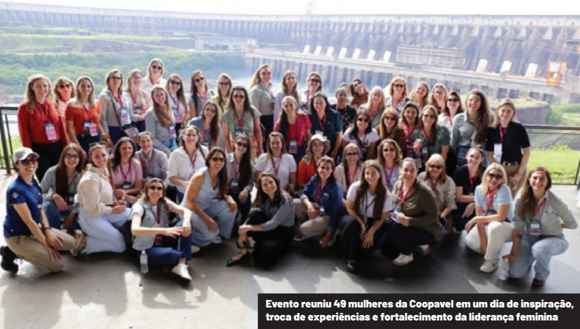
Evento reuniu 49 mulheres da Coopavel em um dia de inspiração, troca de experiências e fortalecimento da liderança feminina

O Itaipu Parquetec recebeu, dias atrás, 49 mulheres da Coopavel para o Encontro Lideranças Femininas, uma iniciativa que uniu inspiração, empoderamento e troca de experiências em um dia de imersão. Guiada pelo tema Conexão que move: mulheres que inspiram, a programação foi marcada por momentos de interação, reflexões sobre o protagonismo das mulheres na transformação do mercado de trabalho e da sociedade.