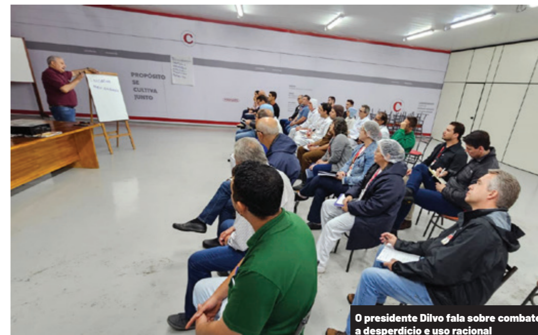
O presidente Dilvo fala sobre combate a desperdício e uso racional