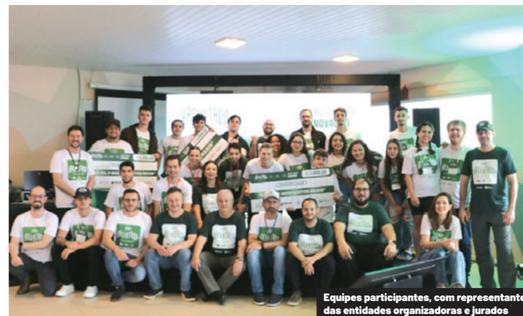
Equipes participantes, com representantes das entidades organizadoras e jurados

O futuro da fruticultura no Oeste do Paraná ganhou novos contornos recentemente com a realização do Hackathon Fruit Cultura, promovido pelo Espaço Impulso/Coopavel em parceria com Itaipu Parquetec, Crea-Paraná, Sebrae, IDR-Paraná, AcicLabs, Unioeste, Fundetec, Iguassu Valley e Biolabore. A equipe vencedora, Root & Fruit, apresentou a solução TraceFarm e conquistou o primeiro lugar em uma maratona que reuniu 19 participantes, divididos em sete times, em 30 horas de trabalho.