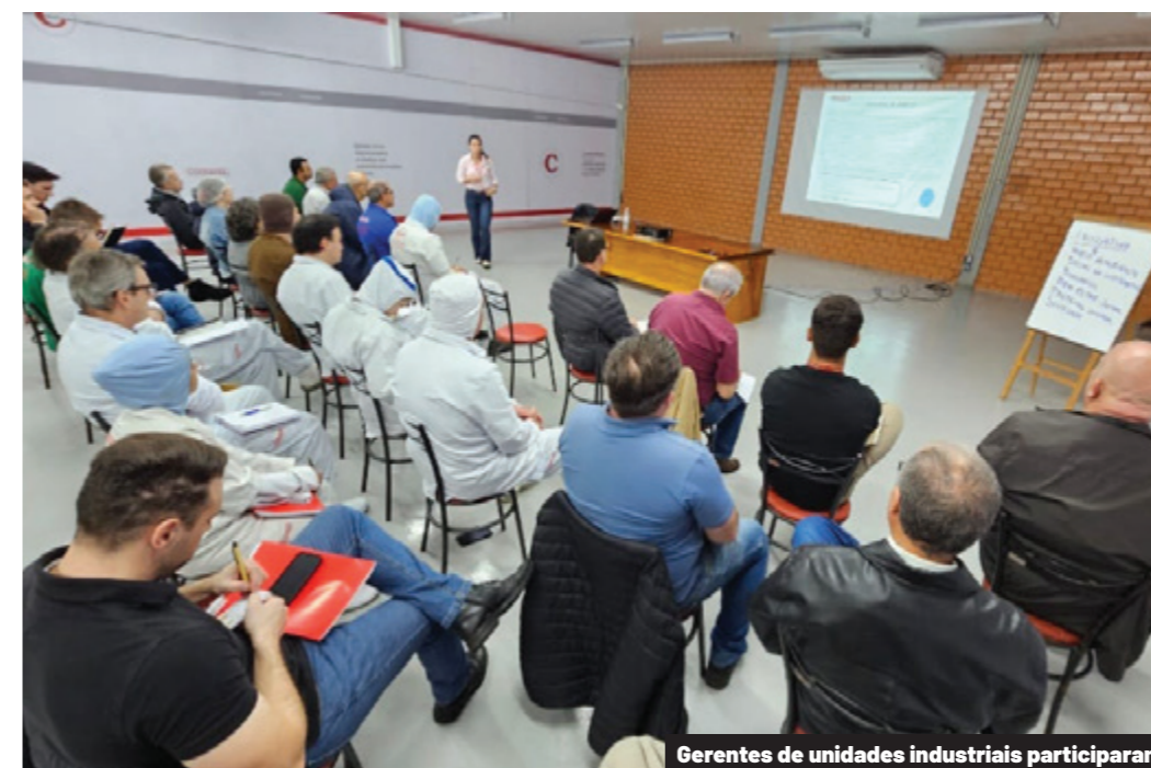
Gerentes de unidades industriais participaram