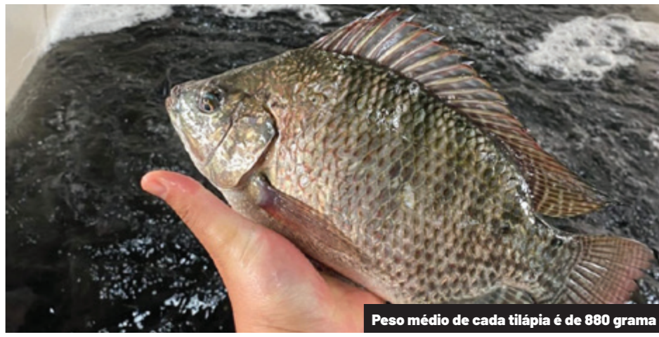
Peso médio de cada tilápia é de 880 grama