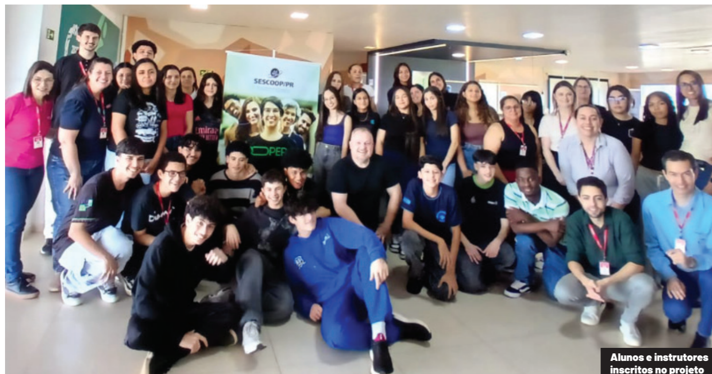
Alunos e instrutores inscritos no projeto

Nos dias 17 e 18 de setembro, a Coopavel promoveu mais uma edição das Trilhas de Desenvolvimento do Programa Impulso Jovem, iniciativa que acontece mensalmente na Unicoop (Universidade Corporativa da Coopavel). O projeto tem como finalidade fortalecer habilidades técnicas e comportamentais dos aprendizes, sempre em sintonia com a cultura organizacional da cooperativa, que em dezembro chegará aos seus 55 anos.