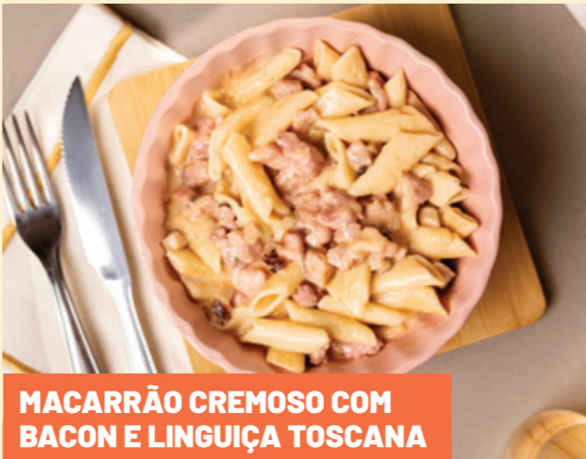
MACARRÃO CREMOSO COM BACON E LINGUIÇA TOSCANA