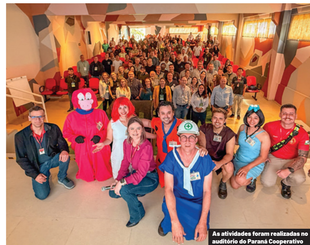
As atividades foram realizadas no auditório do Paraná Cooperativo

Com o tema A força de que vem de dentro, a edição de 2026 vai reunir 600 expositores, os maiores de cada segmento da cadeia do agro brasileiro e mundial. A expectativa é reunir produtores rurais, técnicos, acadêmicos, mulheres e filhos de agricultores, além de diretores de empresas nacionais e estrangeiras, para um evento que é referência em qualidade, organização e que se transforma em palco a novidades e inovações para o agro. O Show Rural Coopavel abre o calendário anual brasileiro dos grandes eventos do setor.