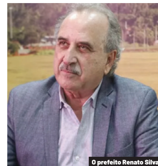
O prefeito Renato Silva