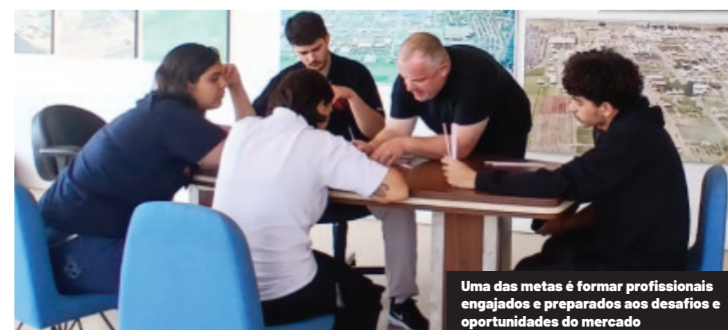
Uma das metas é formar profissionais engajados e preparados aos desafios e oportunidades do mercado