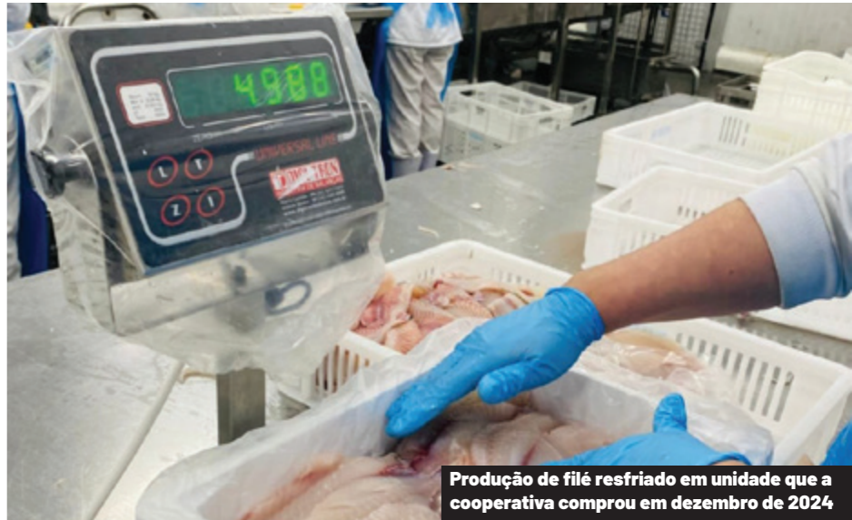
Produção de filé resfriado em unidade que a cooperativa comprou em dezembro de 2024

em dezembro de 2024, com a aquisição da Pescados Cas-cavel, frigorífico fundado em 2010 pela família Marmentini, em Centralito. A operação foi uma das maiores aquisições da história da cooperativa e marcou a chegada de uma nova proteína ao portfólio de carnes da marca, que ajuda a abastecer o Brasil e mais de 40 países.