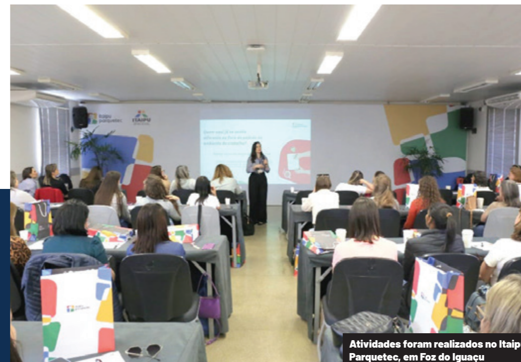
Atividades foram realizadas no Itaipu Parquetec, em Foz do Iguaçu

Encerrando a programação, na parte da tarde as convidadas realizaram uma visita panorâmica pela Itaipu Binacional, conduzida por motorista e guia mulheres, em um momento reforçou o protagonismo feminino para que a mulher possa ocupar a profissão que desejar.