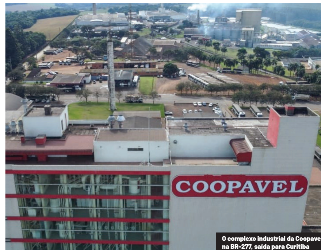
O complexo industrial da Coopavel, na BR-277, saída para Curitiba