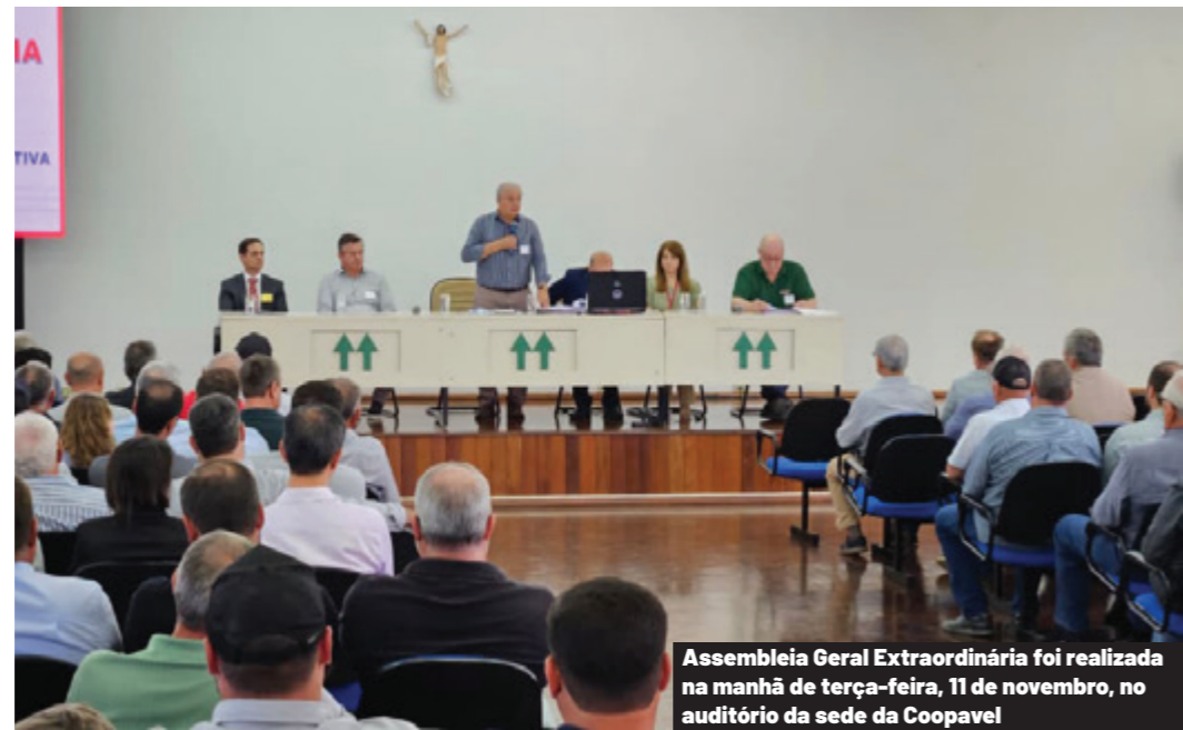
Assembleia Geral Extraordinária foi realizada na manhã de terça-feira, 11 de novembro, no auditório da sede da Coopavel

Um estudo técnico aprimorado ao longo de quatro anos teve seu auge no dia 11 de novembro com a aprovação unânime de atualizações que modernizam o estatuto da Coopavel. As mais profundas alterações no estatuto, em 55