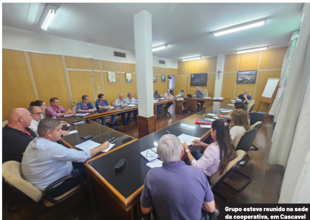
Grupo esteve reunido na sede da cooperativa, em Cascavel

A Coopavel iniciou um novo capítulo em seu modelo de definições de metas, gestão e execução de projetos. Durante Assembleia Geral Extraordinária realizada em 11 de novembro, os cooperados aprovaram, entre outros pontos à atualização do estatuto, a criação do Conselho Executivo, grupo composto por gerentes de áreas e superintendentes responsável por planejar e conduzir ações fundamentais para o futuro da cooperativa.