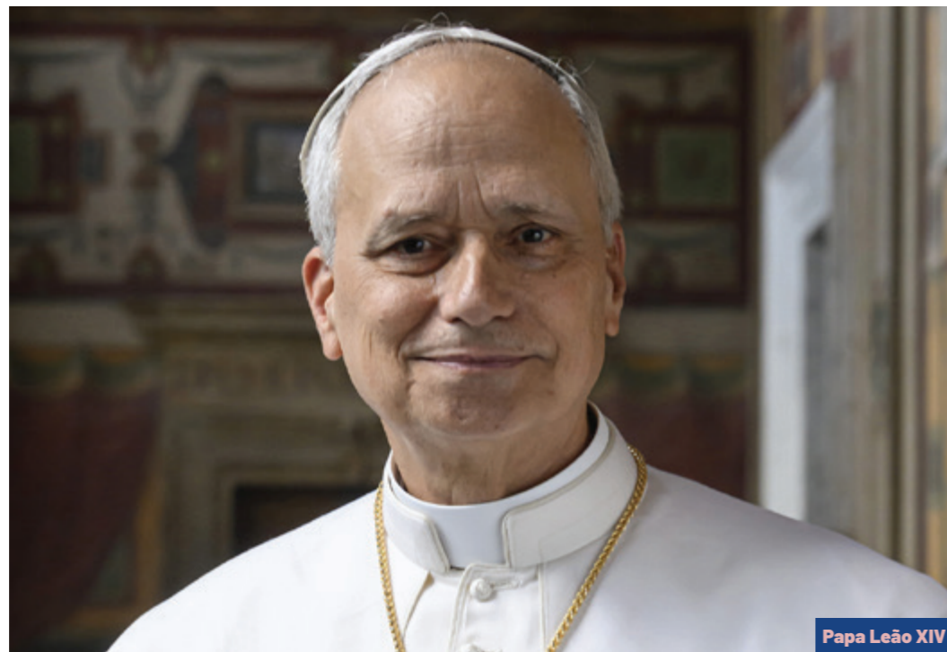
Papa Leão XIV

Foto oficial Leão XIV