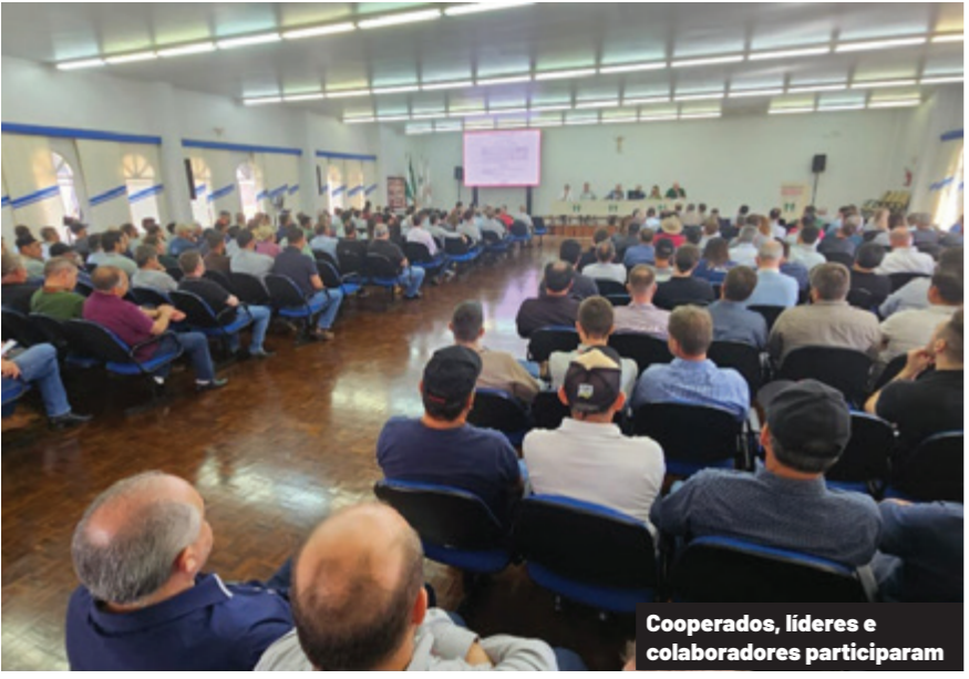
Cooperados, líderes e colaboradores participaram

A AGE aprovou as atribuições do Conselho de Administração, do diretor-presidente do Conselho de Administra-