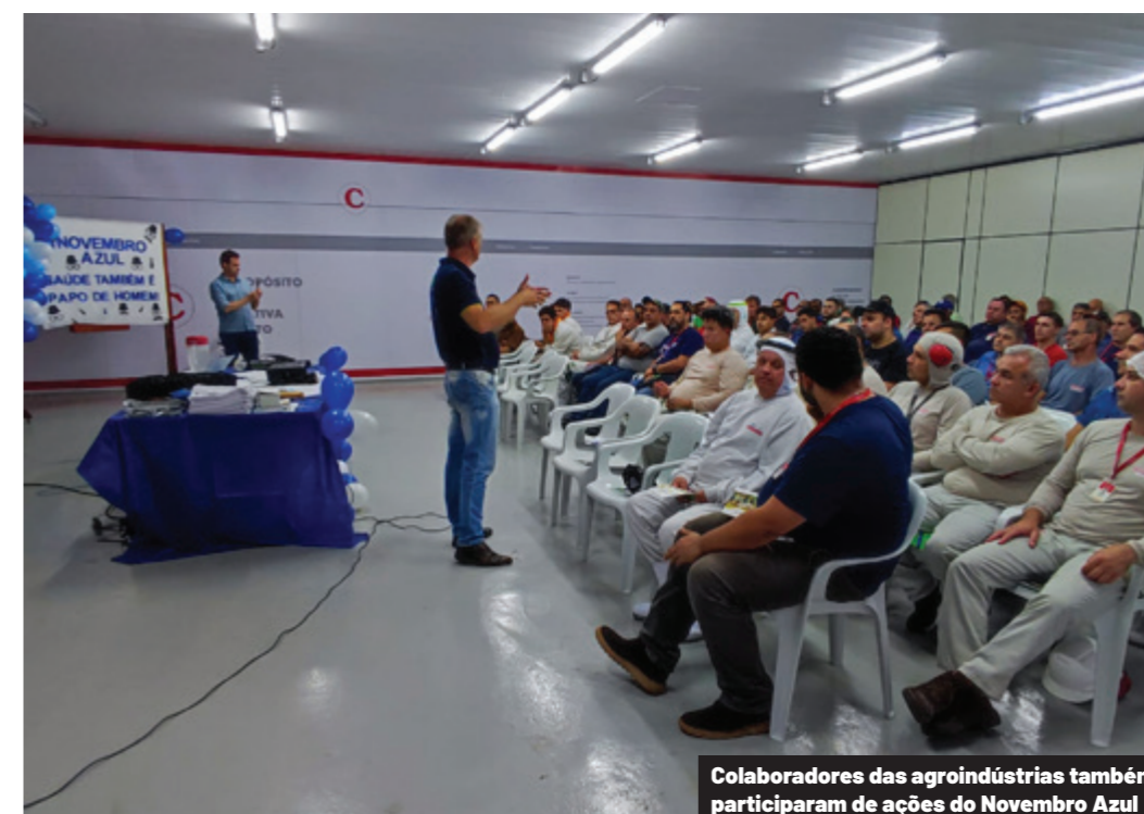
Colaboradores das agroindústrias também participaram de ações do Novembro Azul