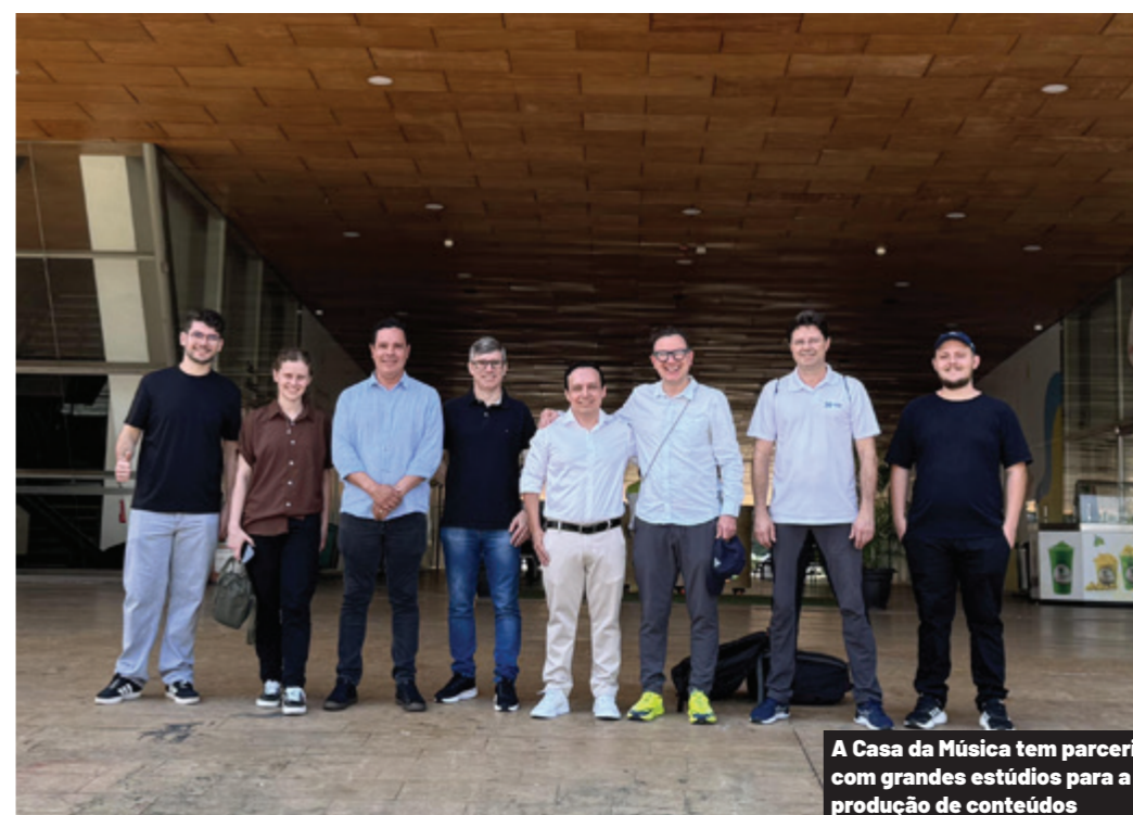
A Casa da Música tem parceria com grandes estúdios para a produção de conteúdos

Outra experiência marcante foi a visita ao Cesa de Medellín, comenta Neto, uma estrutura ampla e multifuncional que difere dos modelos brasileiros. Além de hortifrutigranjeiros, o complexo abriga papelerias, serviços diversos e até oficinas mecânicas. A solução, simples e eficiente, nasceu da necessidade de atender caminhões que chegavam ao entreposto com pequenos danos, dificultando a logística. Com as oficinas no próprio local, os ajustes são realizados enquanto os veículos descarregam, reduzindo tempo e custos. Para a delegação brasileira,