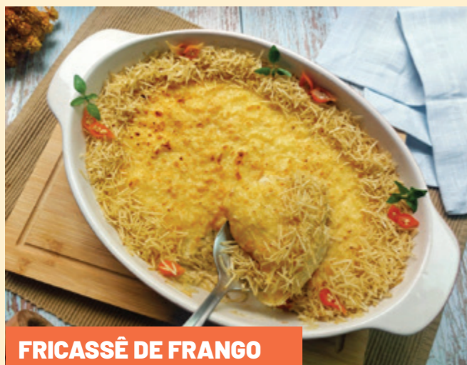
FRICASSÊ DE FRANGO