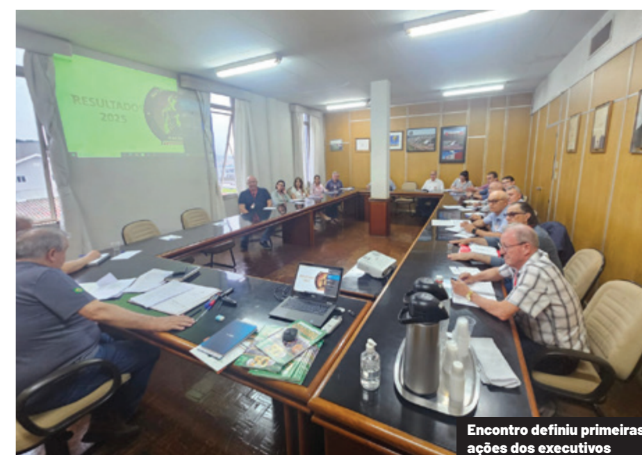
Encontro definiu primeiras ações dos executivos

Presidente do Conselho de Administração da Coopavel