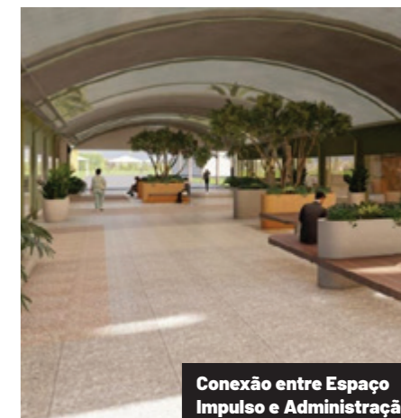
Conexão entre Espaço Impulso e Administração