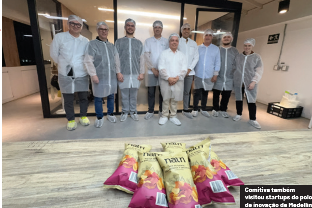
Comitiva também visitou startups do polo de inovação de Medellín

o exemplo ilustrou bem a mentalidade empreendedora que permeia o ecossistema local.