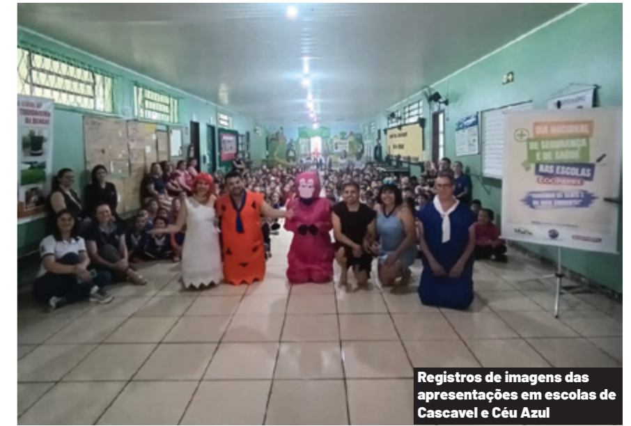
Registros de imagens das apresentações em escolas de Cascavel e Céu Azul