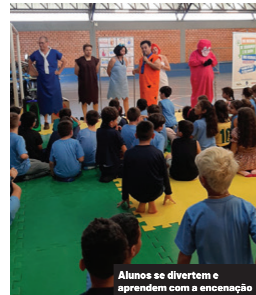
Alunos se divertem e aprendem com a encenação