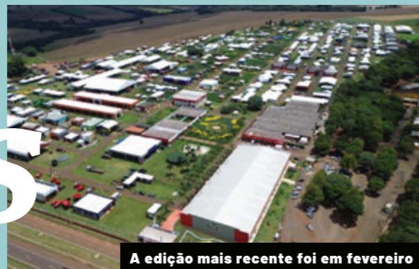
A edição mais recente foi em fevereiro