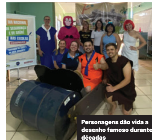
Personagens dão vida a desenho famoso durante décadas