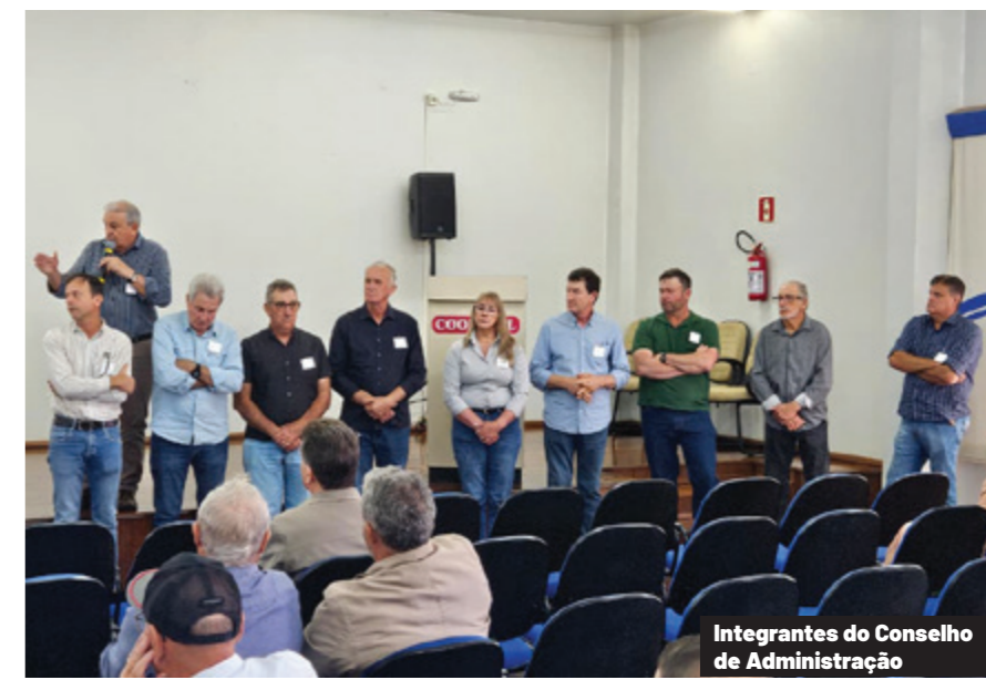
Integrantes do Conselho de Administração