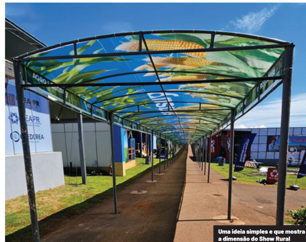
Uma ideia simples e que mostra a dimensão do Show Rural