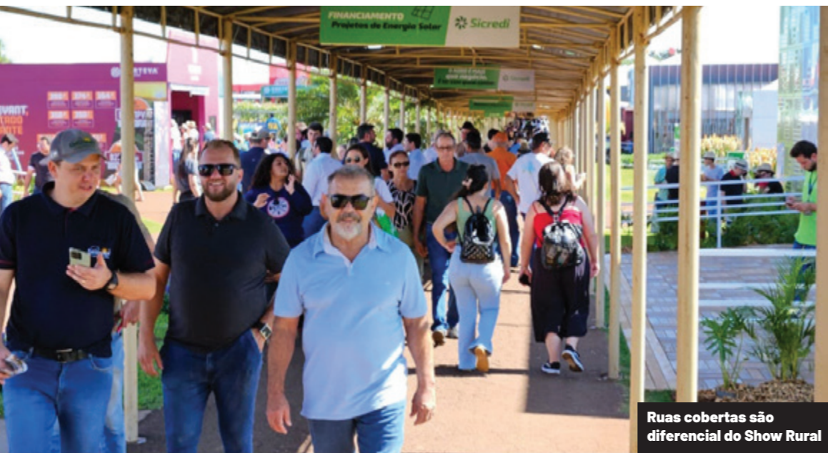
Ruas cobertas são diferencial do Show Rural

A área que desde 1989 recebe o Show Rural Coopavel é uma espécie de canteiro de obras permanente. O evento que é sinônimo de inovação e superação, é também um ambiente marcado por constantes melhorias estruturais, tudo para receber bem e com o máximo conforto as centenas de milhares de pessoas que todos os anos se deslocam a Cascavel para conhecer tendências, novidades e lançamentos de empresas brasileiras e mundiais do agro.