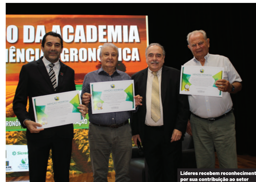
Líderes recebem reconhecimento por sua contribuição ao setor