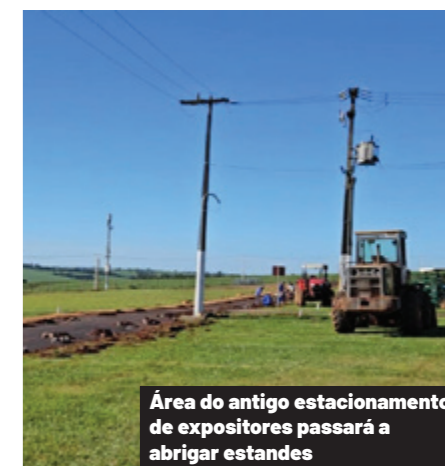
Área do antigo estacionamento de expositores passará a abrigar estandes