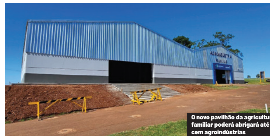
O novo pavilhão da agricultura familiar poderá abrigar até cem agroindústrias