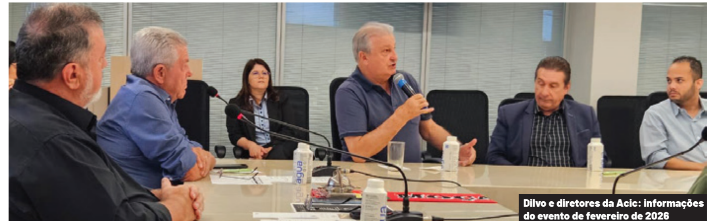
Dilvo e diretores da Acic: informações do evento de fevereiro de 2026

A regra suprema na Igreja é o amor: ninguém é chamado a comandar, todos são chamados a servir; ninguém deve impor as próprias ideias, todos devemos ouvir-nos reciprocamente; ninguém é excluído, todos somos chamados a participar; ninguém possui toda a verdade, todos devemos procurá-la juntos e humildemente. O amor não é fruto do acaso, mas de uma escolha consciente.