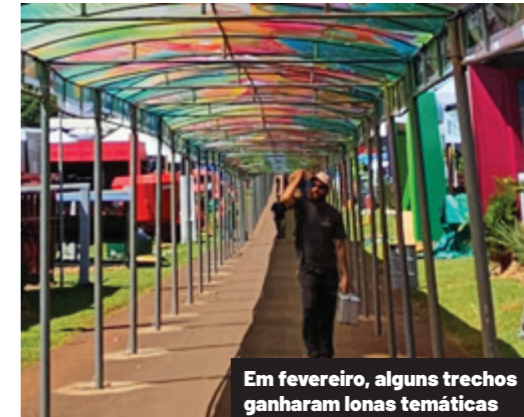
Em fevereiro, alguns trechos ganharam lonas temáticas

te das ruas que ligam todo o interior da área estará pavimentada e coberta. “Faltarão pouco mais de quatro mil metros lineares para concluirmos essa tarefa”, de acordo com ele. Com o tema A força que vem de dentro, o 38º Show Rural Coopavel vai ser realizado de 9 a 13 de fevereiro de 2026, em Cascavel, no Oeste do Paraná. O acesso ao parque e a utilização do estacionamento são gratuitos.