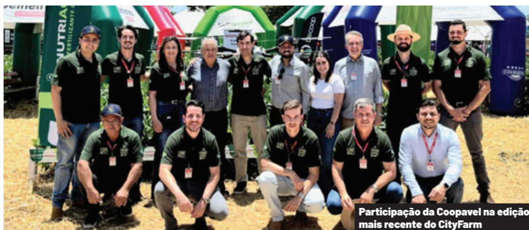
Participação da Coopavel na edição mais recente do CityFarm