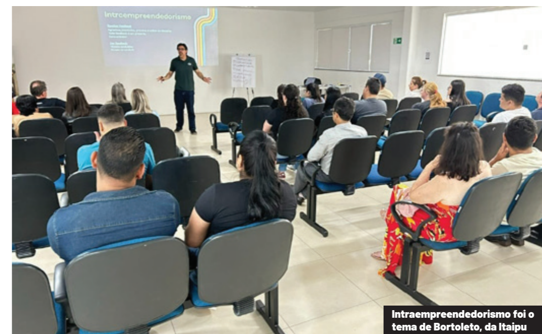
Intraempreendedorismo foi o tema de Bortoleto, da Itaipu