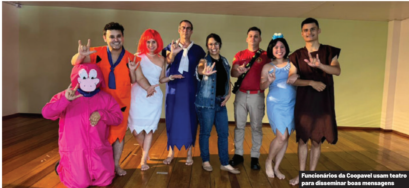
Funcionários da Coopavel usam teatro para disseminar boas mensagens