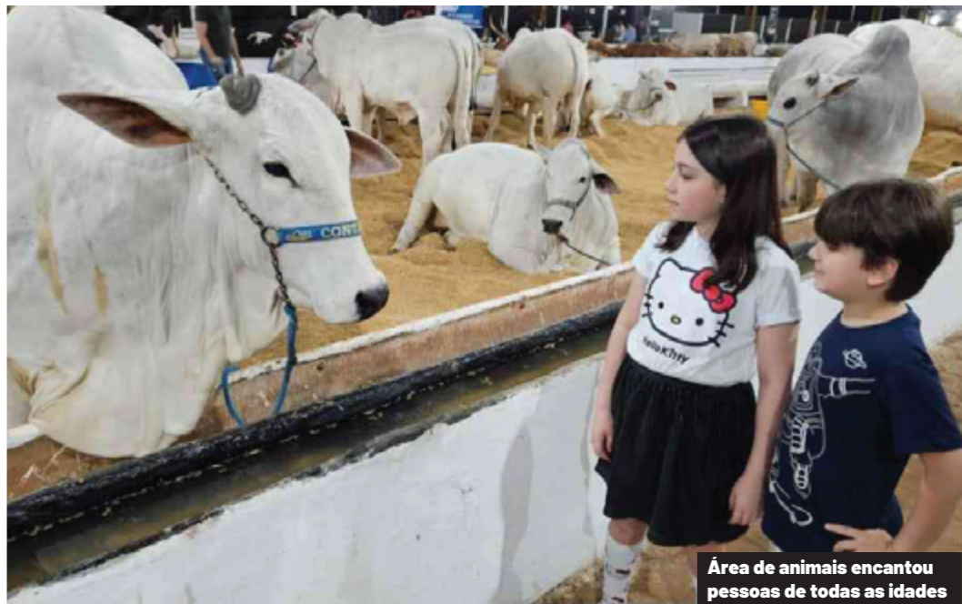
Área de animais encantou pessoas de todas as idades

A cerimônia de abertura da Expovel contou ainda com a presença de secretários de Estado, entre eles Leonaldo Paranhos, do Turismo, e de deputados, como os estaduais Marcio Pacheco e Oziel Luiz, e o federal Nelsinho Padovani. Também participou o presidente da Amop (Associação dos Municípios do Oeste do Paraná), Rodrigo Schanoski, reforçando o prestígio e a representatividade do evento junto aos líderes políticos e setoriais. Com uma programação diversificada, a Expovel 2025 atraiu público recorde de Cascavel e também de municípios vizinhos e de outras regiões do Estado.