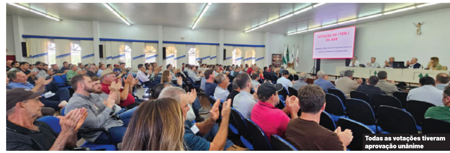
Todas as votações tiveram aprovação unânime