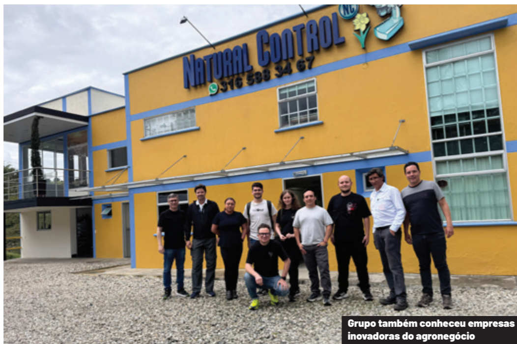
Grupo também conheceu empresas inovadoras do agronegócio