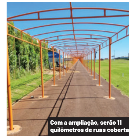
Com a ampliação, serão 11 quilômetros de ruas cobertas