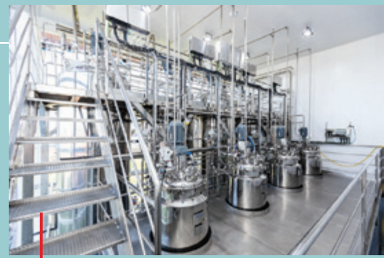
Biocoop, fábrica de insumos biológicos