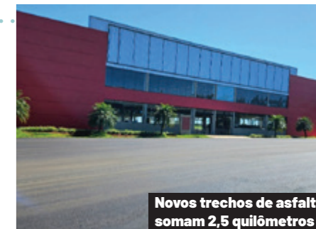
Novos trechos de asfalto somam 2,5 quilômetros

Uma nova passarela vai ligar o estacionamento ao novo portão principal do parque. A maior parte do trecho é elevada, passando sobre o antigo estacionamento. Além disso, outras duas lanchonetes serão implantadas no parque, bem como ampliado o número de estações no restaurante para que mais pessoas possam se servir simultaneamente. No Show Rural Coopavel, o acesso ao parque e o uso de vagas de estacionamento são gratuitos.