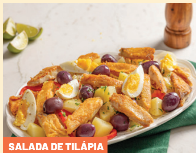
SALADA DE TILÁPIA

Retire o fricassê do forno e finalize com batata palha por cima do queijo gratinado. Você pode decorar como preferir, por exemplo, adicionando pimenta-biquinho, ou rodela de tomate-cereja, e folhinhas de manjeriço.