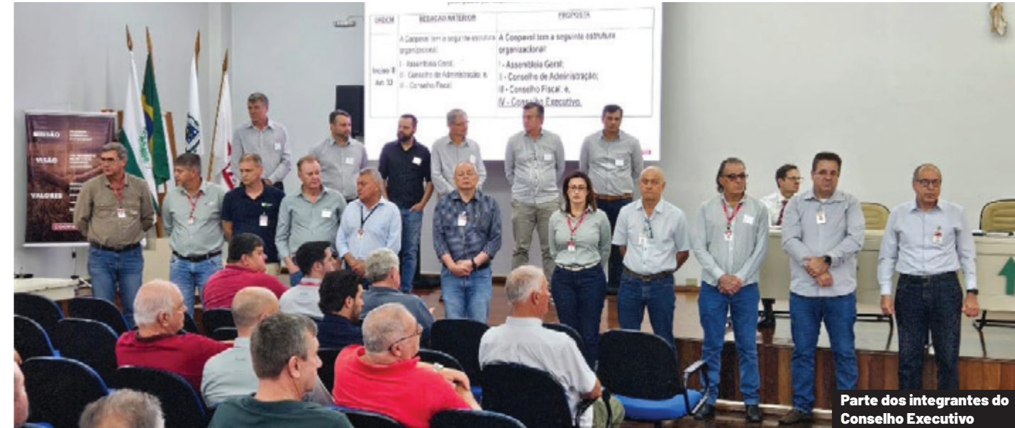
Parte dos integrantes do Conselho Executivo