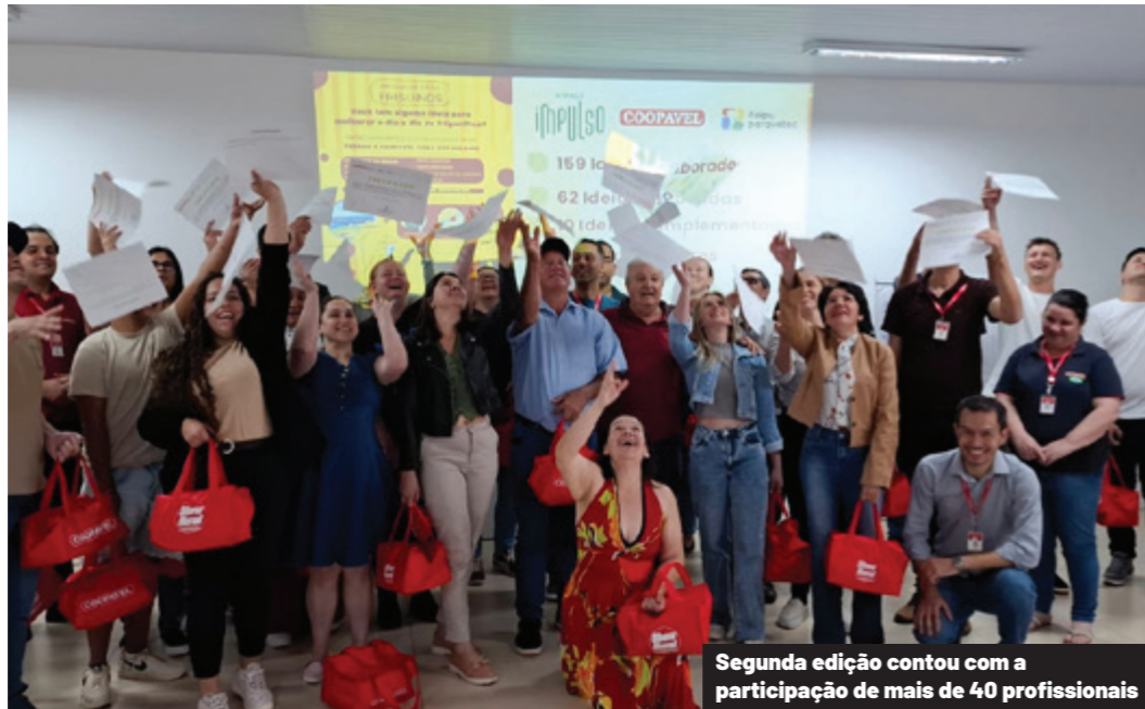
Segunda edição contou com a participação de mais de 40 profissionais