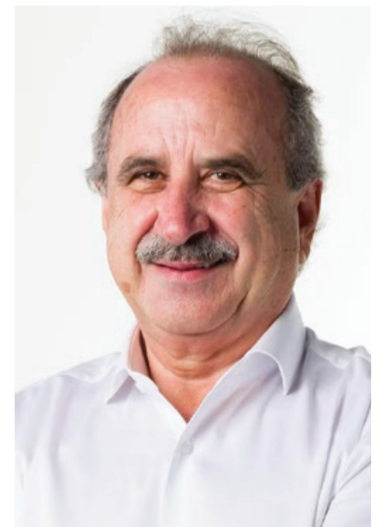
RENATO SILVA Prefeito de Cascavel

“Grandeza, sinal de cooperação, na verdade, porque é cooperativa, coopera com o desenvolvimento, com o crescimento, com a riqueza da nossa gente, do nosso povo, do nosso município de Cascavel e de toda a região. Os 55 anos da Coopavel são um marco pra nós. A Cooperativa faz parte da nossa história, da história dos nossos produtores e suas famílias. Uma cooperativa forte significa uma comunidade forte. Não é só uma cooperativa, é também a união da sociedade, é a oportunidade de crescer, e ter conhecimento através dos muitos eventos que a Coopavel realiza e oportuniza às famílias que vivem no campo. Um exemplo é o Show Rural, que a cada edição se supera em público e oportunidades de melhoria da produção no campo. Então a Coopavel significa muito para Cascavel. É uma referência no Estado e no Brasil e a gente tem muito orgulho da nossa cooperativa”.