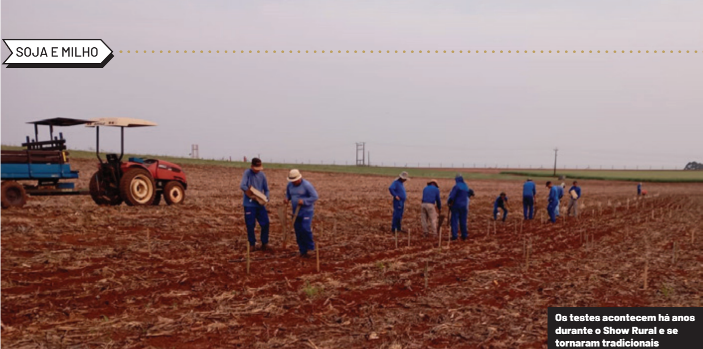
Os testes acontecem há anos durante o Show Rural e se tornaram tradicionais