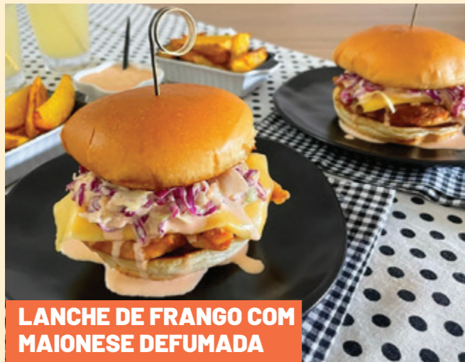
LANCHE DE FRANGO COM MAIONESE DEFUMADA