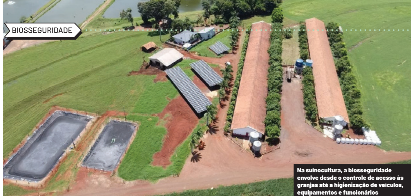
Na suinocultura, a biosseguridade envolve desde o controle de acesso às granjas até a higienização de veículos, equipamentos e funcionários