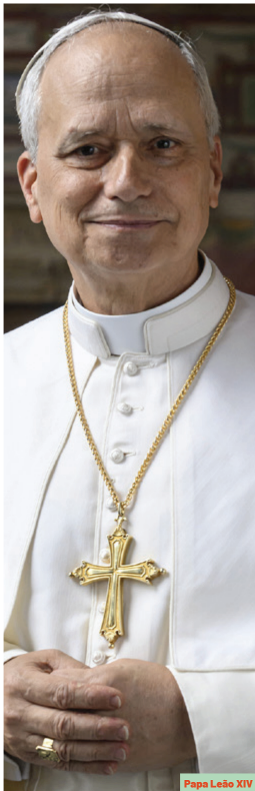
Papa Leão XIV

Foto oficial Leão XIV