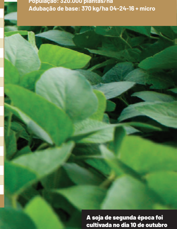
A soja de segunda época foi cultivada no dia 10 de outubro