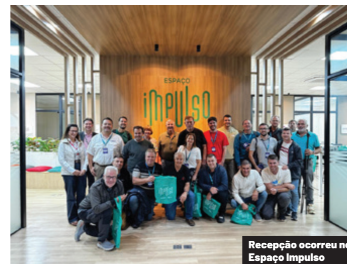
Recepção ocorreu no Espaço Impulso