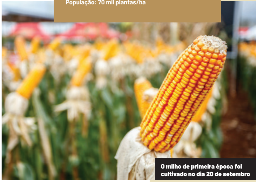
O milho de primeira época foi cultivado no dia 20 de setembro

Plantio 20/09/2025 adubação de base: 370 kg/ha de 08-20-20 + micro Adubação de cobertura: 185 kg/ha de ureia População: 70 mil plantas/ha