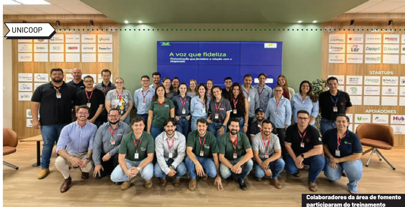
Colaboradores da área de fomento participaram do treinamento