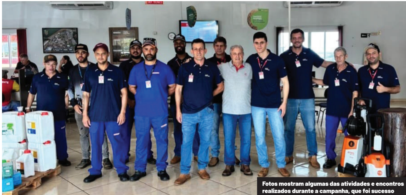
Fotos mostram algumas das atividades e encontros realizados durante a campanha, que foi sucesso