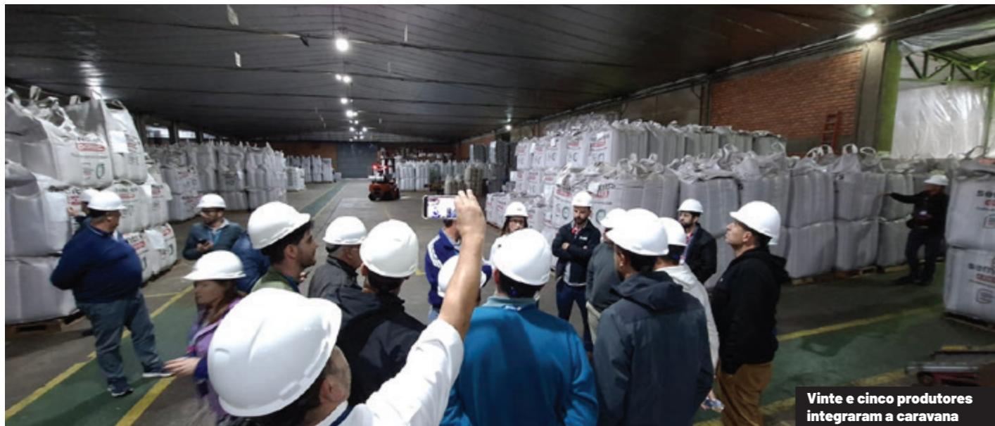
Vinte e cinco produtores integraram a caravana