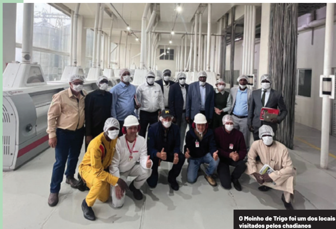
O Moinho de Trigo foi um dos locais visitados pelos chadianos