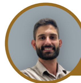
Filial de Juvinoópolis

Qualquer mudança nesse sentido deve ser precedida de amplo debate, análise de impacto e respeito à realidade dos setores produtivos, sob pena de comprometer a competitividade das empresas, a geração de empregos e a própria sustentabilidade da atividade econômica.