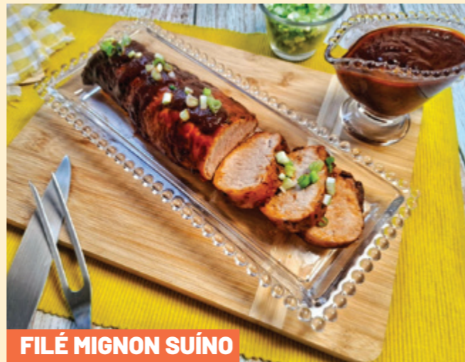
FILE MIGNON SUÍNO