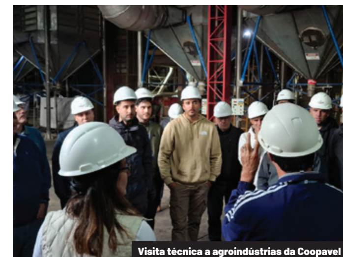
Visita técnica a agroindústrias da Coopavel